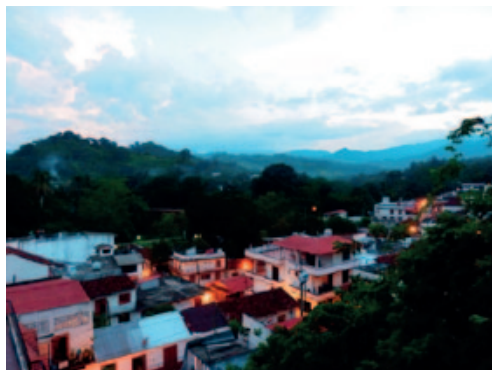
Figura 2: Tapijulapa Pueblo Mágico

El pueblo está rodeado de selvas entre los márgenes de los ríos Amatan de aguas verdes y Oxolotán de color marrón. El legado cultural se expresa en sentido colonial de la arquitectura del pueblo. El Templo de Santiago Apóstol construido hacia finales del siglo XVII. [Entrada Figura 2 y 3].