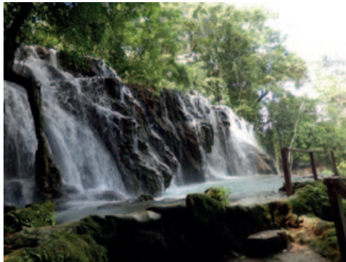
Figura 3: Cascada de Azufre. Tapijulapa