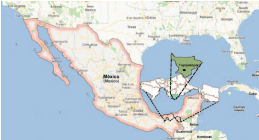
Figura 1: Mapa de la ubicación de Tapijulapa Pueblo Mágico

para el 2012 el Comité de Pueblo Mágico reportó que habían arribado 54,220 turistas nacionales y 827 extranjeros, haciendo un total de 55,047 visitantes. [Entrada Figura 1].