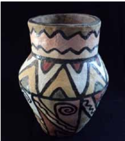
Figura 1. Vaso Kinikinau Artesã: Agueda Roberto