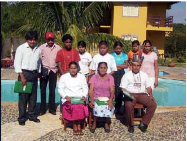
Figura 2. Pousada em Bonito. Grupo Kinikinau no Seminário “Povo Kinikinau: Persistindo a resistência”