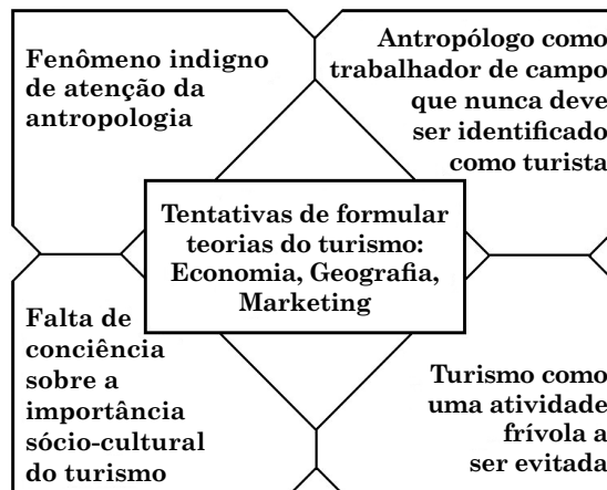
Figura 1. O evitamento do turismo pela antropologia. Baseado em Burns, 2002.

Do mesmo modo, alguns autores hoje referenciais nos estudos sobre o turismo, como Leiper ou Valene Smith, também indicaram terem sido desencorajados a trabalhar com o tema no começo das suas carreiras (Crick, 1992). Yamashita reconheceu que, quando realizava seu primeiro trabalho de