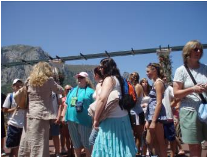
Foto 2. El uniforme del turista: entre transgresión y regresión a la infancia.

Sin embargo, esta presupuesta pasividad podría esconder un potencial de creatividad y de experimentación. Es cierto que el carácter "liminoide" de la situación de viaje, con su suspensión de los papeles de la vida ordinaria, brinda el escenario para la adopción de nuevas conductas, antiestructurales y fuera de lo corriente (Pi-Sunyer 1977, en Santana, 1997), marcando el paso hacia la reinención del individuo en su nueva identidad temporal de turista.