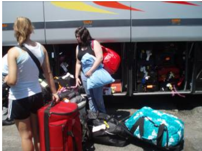
Foto 3. El equipaje: un instrumental para mitigar la separación del hogar.

referencia. Según Giddens (1991) es una forma emocional conectada con tipos de rutina o de hábitos y, por lo visto, los turistas, después de haberse ajustado a su nueva rutina diaria, tienden a reproducirla en cuanto abandonan el entorno que se la proporciona de forma natural. La curiosidad por un MacDonalD o un Starbucks europeo, en los que los turistas, en todos los viajes, iban a comer por lo menos una vez y sobre todo hacia al final del viaje, no tenía que ver - como comentó una de los participantes - con la calidad de la comida, sino más bien con la seguridad y la tranquilidad que estos lugares proporcionan por su geografía repetitiva, frente a un contexto exterior con pocas referencias. “Les ha gustado enormemente - dijo una participante adulta - ver que hay Starbucks aquí. Les encantó. Por una vez se sintieron seguros y confortables”.