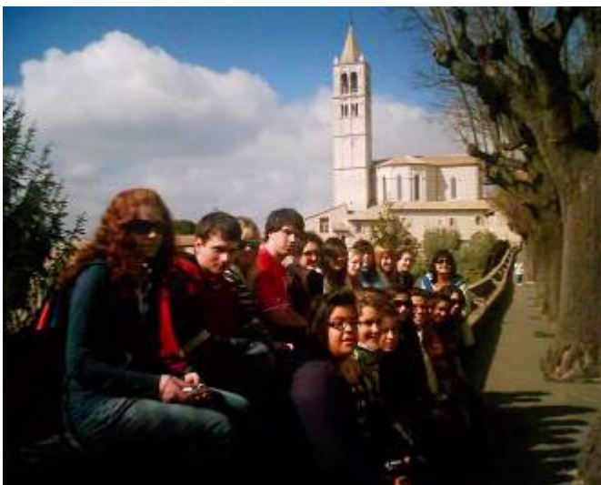
Foto 1. Una clase en movimiento.

jetivo, en nuestro contexto la burbuja se presentaba como una forma de control, relacionada tanto con la juventud de la mayoría de los participantes, como con la fórmula del viaje, caracterizado por un reparto del tiempo muy rígido y estructurado. Los elementos que la componían eran la presencia del guía, con su papel de interpretación y mediación; la de los profesores, que a pesar de su rol ambivalente de turistas y guardianes, vigilaban y regulaban el natural impulso a la transgresión de los adolescentes; la de los compañeros de viaje, todos de una misma cultura y -en la mayoría de los casos observados- idioma; el microambiente del autocar y, finalmente, la rutina muy intensa. Todos estos elementos reducían notablemente la esfera de autonomía personal y creaban un contexto de “clase en movimiento”.