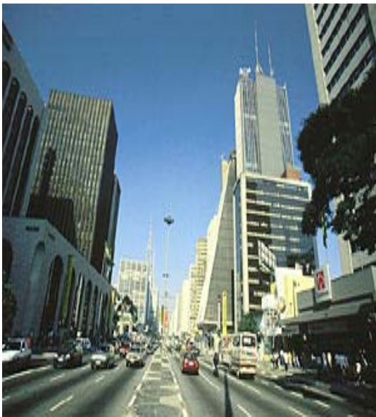
Foto 13. Avenida Paulista.

O centro expandido apresenta grande concentração de bens culturais, faz-se necessário um plano de ação que altere o congelamento das funções ali instituídas, interferindo no processo de reprodução da economia local, revitalizando-a e desenvolvendo um projeto de turismo que garanta a sustentabilidade do patrimônio cultural. A reabilitação do espaço urbano e a revitalização do patrimônio cultural são instrumentos importantes no fortalecimento das manifestações culturais em processo de descaracterização.