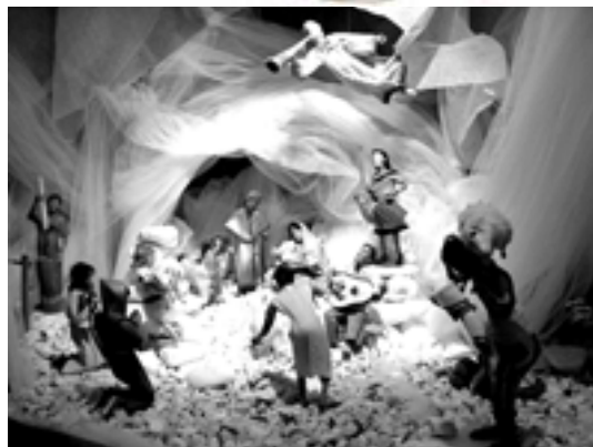
Fotos 7 y 8. Festas populares de caráter devocional.

Os bens foram catalogados mediante a realização de entrevistas com moradores/usuários de bairros pertencentes à área urbana do município. Foram realizadas cerca de 300 entrevistas nas regiões do Bexiga, Bom Retiro, Brás, Butantã, Brooklin, Campo Belo, Centro 15 ,