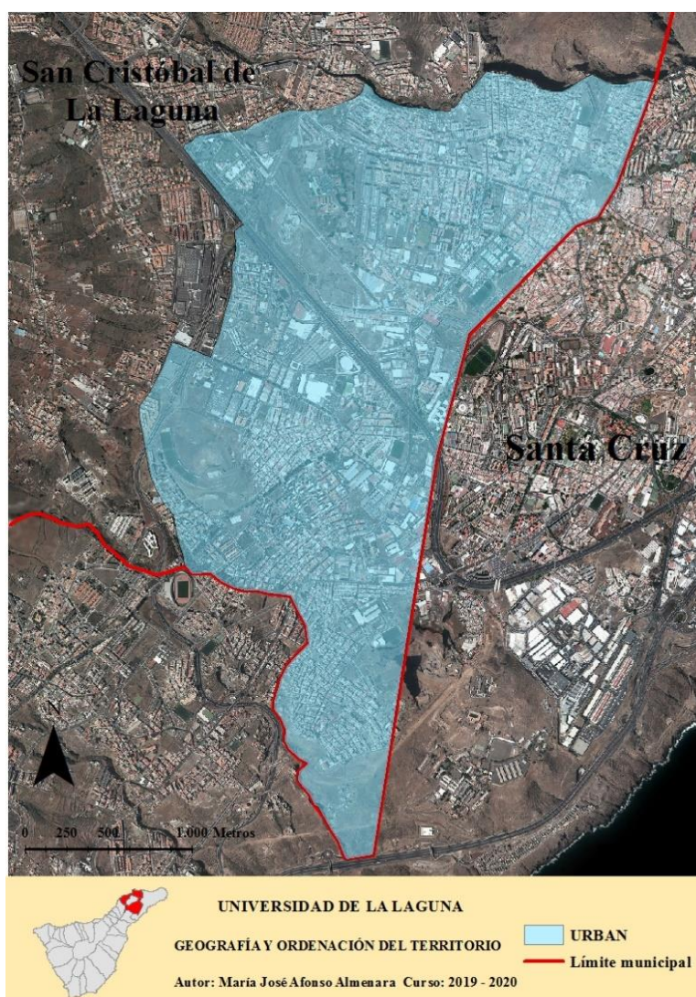
Figura 1: Área zona de actuación URBAN II