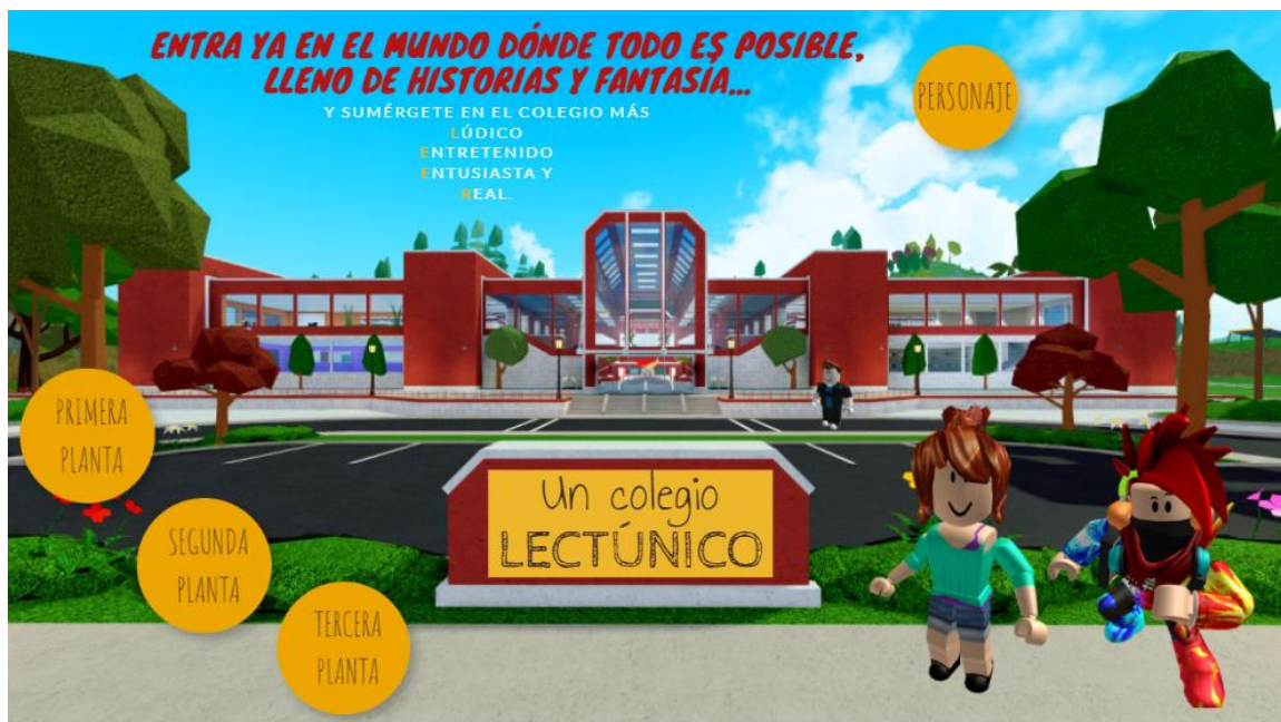
Figura 1. Imagen pantalla principal.

Además, en cada piso habrá un aula destinada para el estudiantado que presente un nivel de desarrollo lingüístico o comprensivo menor que el del resto de compañeras/os. Asimismo, esta aula estará disponible para el alumnado que presente dislexia, con trastorno del espectro autista y con déficit de atención con y sin hiperactividad.