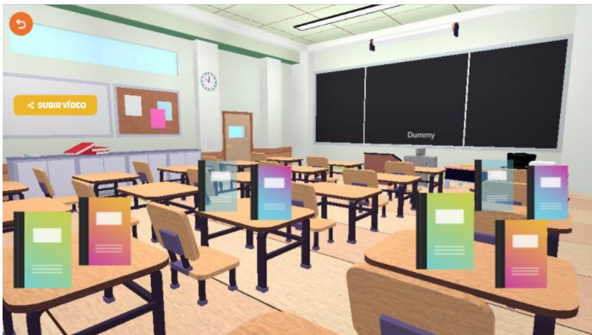
Figura 2. Imagen de una clase.

Lo que se pretende con este recurso web es que, cuando el alumnado haya leído un libro, suba un vídeo a la sección destinada para ello en el apartado “subir vídeo” (figura 2) que se encuentra en el aula de cada curso, realizando una valoración crítica acerca del libro leído. El alumnado del segundo piso, además deberá nombrar su parte favorita del libro. Y, el alumnado del tercer piso, deberá inventarse un final diferente para dicho libro.