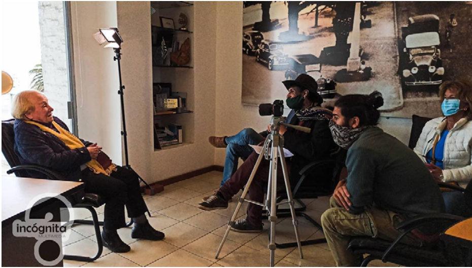
Imagen 2: Rodaje de la serie.

de los antiguos residentes. La miniserie fue transmitida en el mes de julio de 2021, a través del canal del Estado, Televisión Nacional de Uruguay. Posteriormente los capítulos serán publicados en redes sociales, como Facebook y YouTube 10 , y en la carpeta alojada en Google Drive. En general, la miniserie fue muy bien valorada tanto por los protagonistas como por el público. Existe interés de algunas personas en participar de futuras instancias de registro de narrativas, y se recibieron sugerencias de continuar la serie, abordando otros lugares de la península y de Punta del Este.