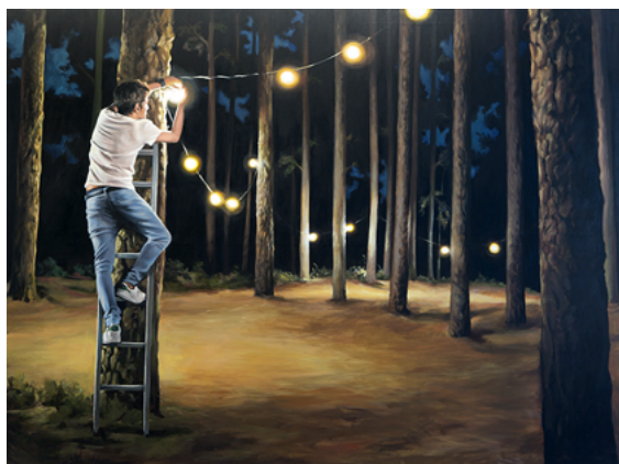
Expo Chicago. Señalando el camino III. Acrílico sobre madera recortada. 180x240 cm 2016.