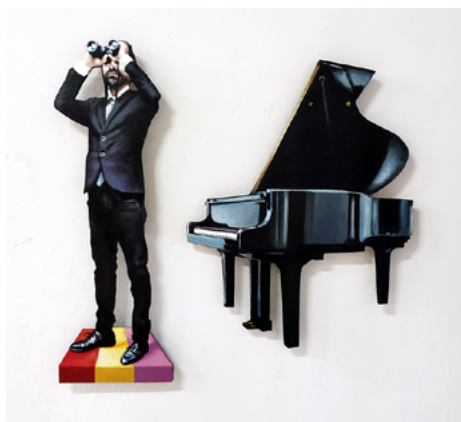
Martín y Sicilia interpretando a Juan Hidalgo, interpretando Música para pianoforte II de W. Marchetti, en piano republicano. Acrílico sobre madera recortada. 80x80 cm. 2021

Por otra parte, con motivo de la exposición individual del pintor José Martín en el Centro Atlántico de Arte Moderno, el museo realizó una exposición paralela que dialogaba con el artista, donde pudo verse, también, obra de Martín y Sicilia de principios del año 2000. Por último, en abril de este año, se inauguró en la Casa de la Cultura Agustín de la Hoz de Lanzarote el proyecto expositivo y editorial que llevaba por título El Gran Libro de la Historia del Arte de Martín y Sicilia , donde se planteaba un recorrido por las diferentes etapas y movimientos artísticos con una