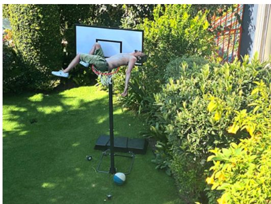
Gallery Weekend. The basquet people. Acrílico sobre madera recortada y estructura de hierro. 180 × 300 cm. 2021.