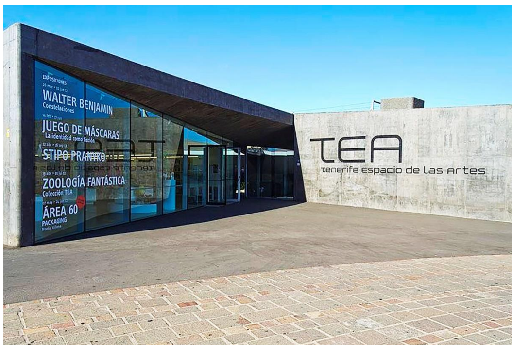
Tenerife Espacio de las Artes, TEA.

mentaba el hallazgo de unos bustos clásicos en el vivero municipal de Santa Cruz que habían quedado atrapados bajo las raíces de un ficus, un árbol procedente de Sudamérica implantado en Canarias. Al extraer y estudiar las esculturas, descubrieron que pertenecieron a una familia burguesa de la ciudad que había adornado la fachada de su vivienda con ellas como símbolo de prestigio. Finalmente, el audiovisual ocultaba una gran metáfora, pues los artistas vieron en ese suceso el sometimiento de Europa (esculturas) por Sudamérica y Canarias (raíces).