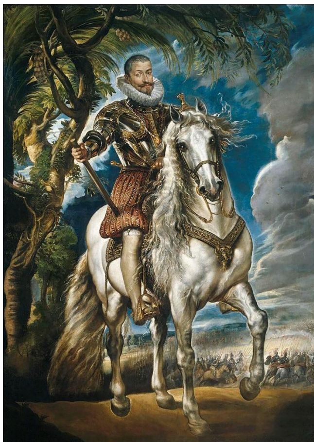
Retrato ecuestre del Duque de Lerma (1603), de Rubens. (Imagen de dominio público)