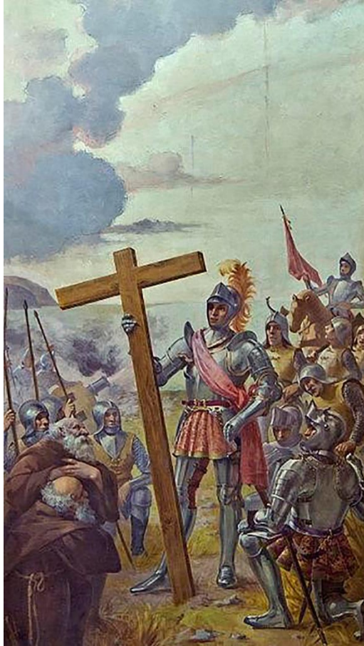
La fundación de Santa Cruz de Tenerife (1906), de Manuel González Méndez. Esta pintura, junto con otra del mismo autor, presiden el Parlamento de Canarias y están sometidas a debate. (Imagen de dominio público)

Actualmente, en Ese otro mundo , la exposición semipermanente que acaba de inaugurar el museo, se puede contemplar la obra de Adrián Alemán, quien en su serie Socius (2008-2011) trabaja este mismo tema a través de fotografías que tomó durante años de los barcos fondeados en el mar de San Andrés, un ejercicio de memoria territorial donde los barcos parecen lápidas flotantes sobre el cementerio del mar, que guarda silencio eternamente.