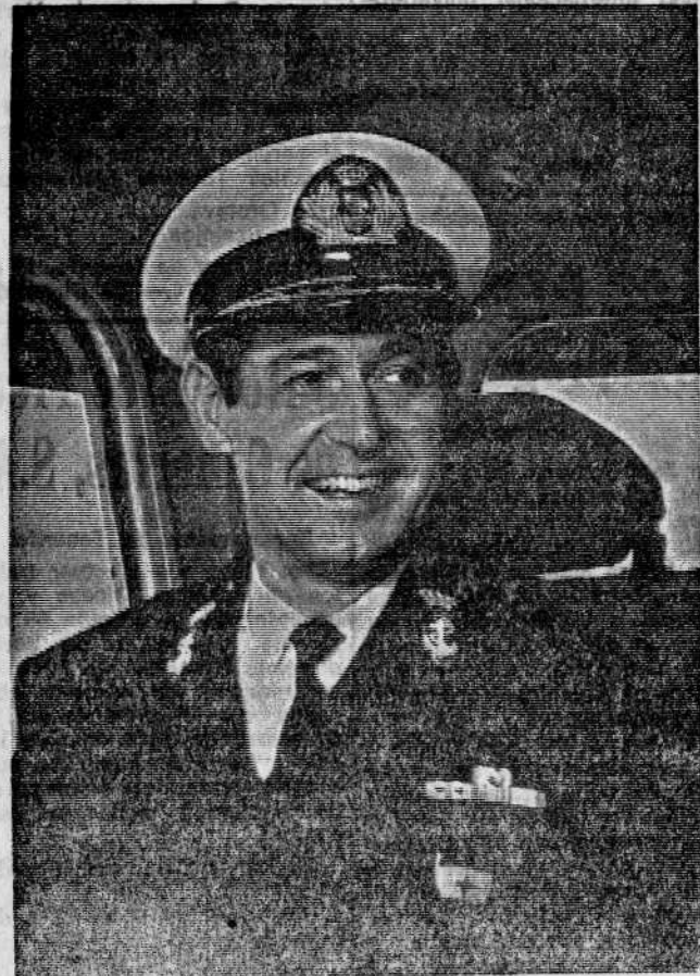
El vicealmirante Wevers, que manda el Task Group que ha realizado maniobras en aguas del Atlántico.

Interesadas presentarse en Restaurante China, Avenida Anaga s/n. U Oficina de Colocación. Oferta número 4.547. (2)