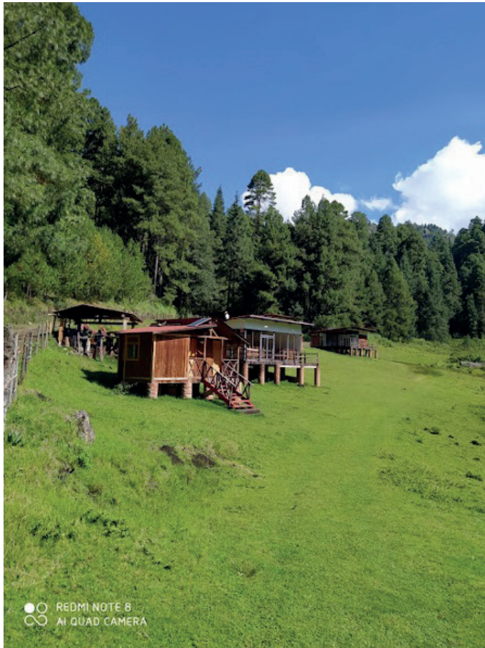
Ilustración 2: Imagen del Parque Matawi, San Francisco Oxtotilpan, México.

Así también, a través del CET se gestionaron distintas capacitaciones para los miembros de la comunidad por parte de consultoras y organizaciones no gubernamentales (como GIZ, https://www.giz.de/en/worldwide/33041.html y La Mano del Mono, https://lamanodelmono.org ), y de la academia (Universidad Autónoma del Estado de México), que orientaron la creación del producto. El Parque es un espacio natural localizado a 4.6 km del centro del pueblo, en el que se localizan tres cabañas que dan servicio de hospedaje y alimentación tradicional indígena. Adicionalmente, el producto turístico comprende la venta de paquetes de actividades como talleres de educación ambiental, elaboración de textiles en telar de cintura, pláticas sobre la cosmovisión matlatzinca y visitación a sitios naturales de la comunidad, como Peña Blanca o el Paraje de las Luciérnagas (ver https://www.facebook.com/parqueecoturisticoaatawioficial ).