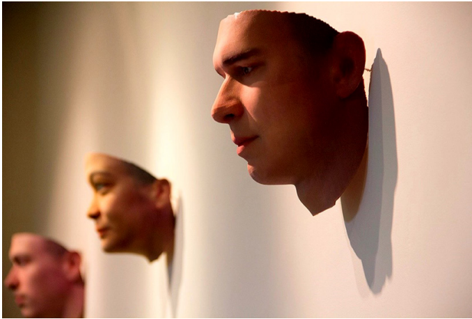
Fig. 1. Stranger Visions , Heather Dewey-Hagborg. http://deweyhagborg.com/projects/stranger-visions .

preguntas: ¿qué define una obra SciArt?, ¿cuáles son sus cualidades intrínsecas nacidas del mestizaje de prácticas que mutan de la multi- a la inter- y cómo llegan a la trans-disciplinariedad?