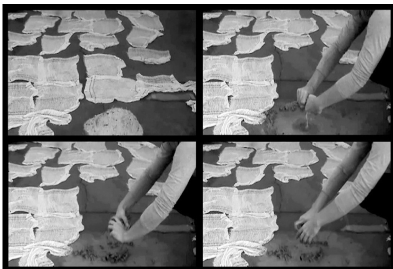
Figura 3. Epanáfora: fregar y estrujar , fotogramas.

obras, la videoperformance Epanáfora: fregar y estrujar trabajó en la reiteración mimética de acciones coyunturales en la vida del trapo 63 . Como el título permite ver, se repitieron dos operaciones consistentes en frotar múltiples trapos a ras del suelo, alternando con la torsión de los mismos por estrujamiento. La idea pone el acento en la trama tautológica de la vida doméstica; practicando un vaciamiento de sentido por desnaturalización iterativa. Se trata de reincidir hasta la disolución del contenido tácito que se fija a la materia. Además de poner en primer plano la pulsión de vida oculta en la fricción de las manos con el objeto.