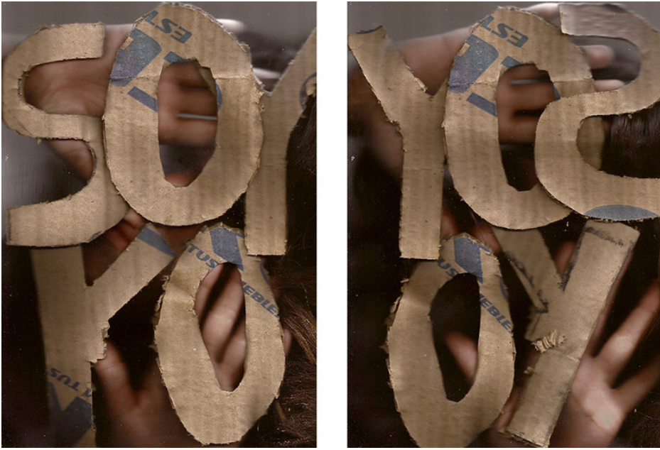
Figura 5. Soy yo no soy , 119 × 84 cm cada uno, carteles escaneados.