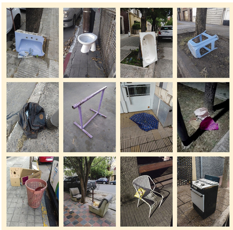
Figura 1. Una casa a la intemperie (fragmento de archivo), 2018-2022.

respecto a su valía y utilitarismo 15 . Pues comprendemos que este flujo de cosas en su condición descartable o levemente recuperable forma parte de una red de asociaciones por la que fuerzas de diferente naturaleza –humanas y no humanas– tejen ecosistemas de vida al interior de una estructura dominante 16 .