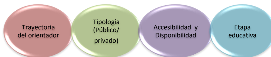
Imagen II: criterios de selección

Para realizar la investigación se han seleccionado tres casos, cada uno de ellos correspondientes a un orientador de centro educativo. Los criterios de selección atienden a la diversidad en la tipología de centros, la trayectoria del orientador educativo, y la etapa educativa con la que se corresponde, así como la disponibilidad y accesibilidad de los profesionales y el propio centro educativo a ofrecer la oportunidad de investigar en la institución.