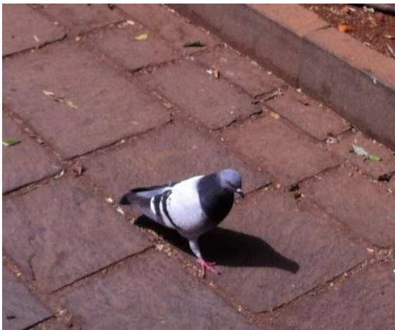
- Paloma bravía, en S.C de Tenerife.