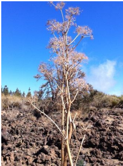
- Cañaheja, en el parque nacional del Teide. (Tenerife)