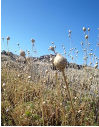
- Cabezón ( Cheirolophus teydis ), en el parque nacional del Teide. (Tenerife.)