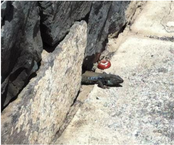
- lagarto tizón, en Añaza S.C de Tenerife.