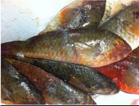
- La vieja, en S.C de Tenerife.