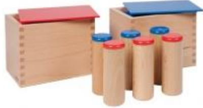
Cajas de Sonidos