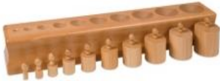
Bloques de cilindros de diferentes tamaños