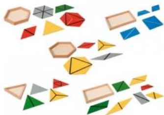
Triángulos y figuras geométricas