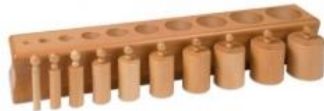
Bloques de diferente grosor