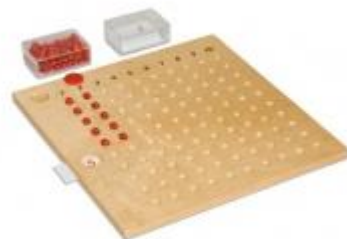
Tabla de Multiplicación