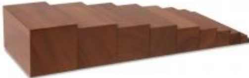
Escalera de peldaños