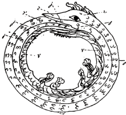
(Figura 3. Uróboro. Sheppard, 1962: 85)

Según se describe en el texto del manuscrito, las cuatro patas representan los cuatro elementos: agua, tierra, aire y fuego; es decir, constituyen la tetrasomía 22 . Las tres orejas hacen referencia a los «tres vapores sublimados»: azufre, mercurio y arsénico.