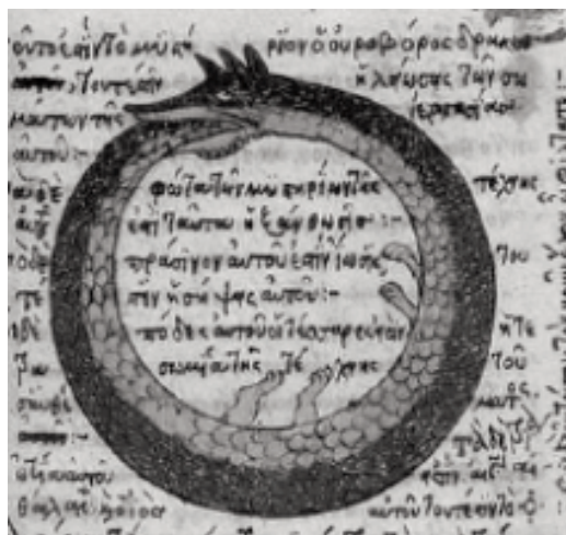
(Figura 4: https://www.flickr.com/photos/ouroboran/2288405597/in/photostream/lightbox/ 28 )

En el folio 279r del mismo manuscrito, se encuentra la segunda figura. La acompaña un texto en el que el principio alquímico es diferente, pero con la misma receta mística. La serpiente que se muerde la cola está compuesta, en este caso, por dos círculos o anillos concéntricos: de colores rojo y verde. Aquí las escamas están mejor marcadas. Como la figura que se comentó anteriormente, está provista también de cuatro pies y tres orejas.