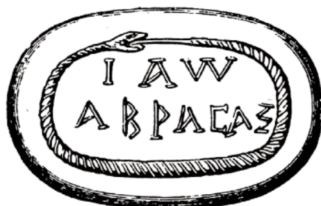
(Figura 1. Ejemplo de gema gnóstica. Sheppard, 1962: 85)

aquella, puesto que recuerdan las sencillas inscripciones en gemas gnósticas en las que el nombre de «Abraxas 7 » está rodeado por la serpiente que se muerde la cola 8 y que solían ser utilizadas como talismán.