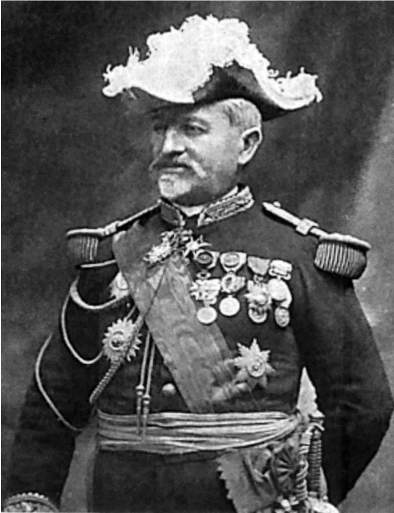
Fig. 1. Retrato del almirante Jules Marie Armand Cavaler de Cuverville. Service Historique de la Défense, Castillo de Vincennes.

Recibido: 18-1-2012. Aceptado: 14-3-2012