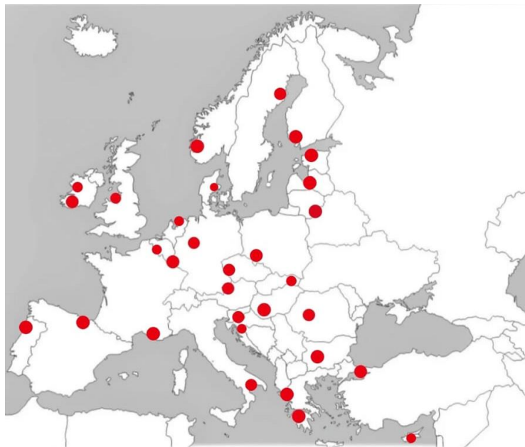
Capitalidades Europeas de La Cultura desde el año 2005 hasta el año 2020