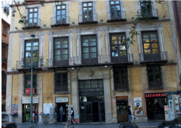
Ilustración 7: Fachada del inmueble ubicado en calle Alameda Principal.