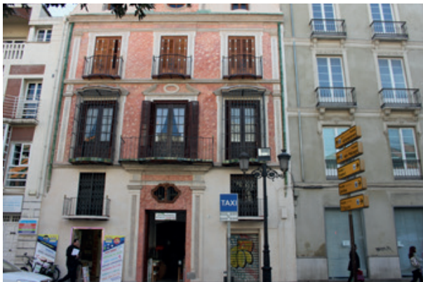
Ilustración 6: Fachada del inmueble ubicado en calle Atarazana.