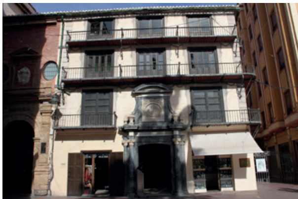
Ilustración 8: Fachada del inmueble ubicado en la Plaza de la Constitución.