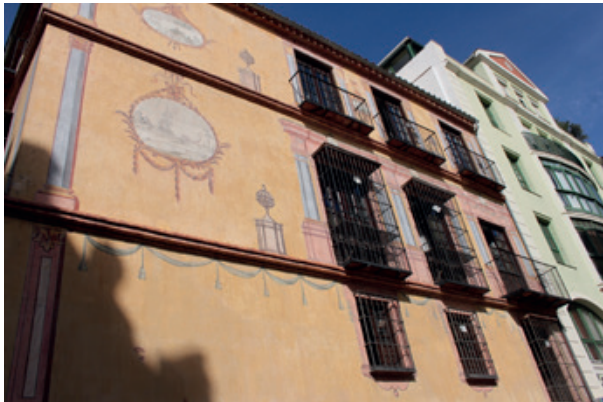
Ilustración 5: Fachada del inmueble ubicado en calle Torregorda.