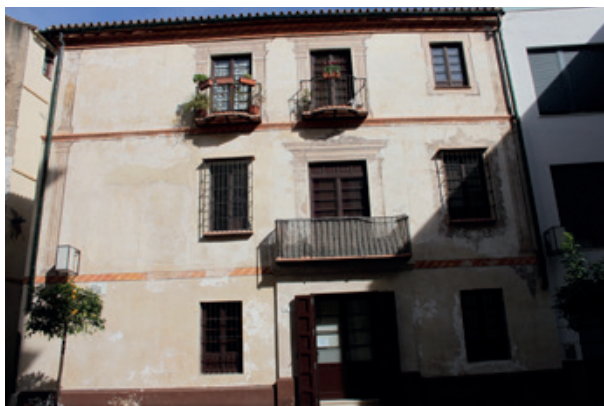
Ilustración 4: Fachada del inmueble ubicado en la Plaza Virgen de las Penas.