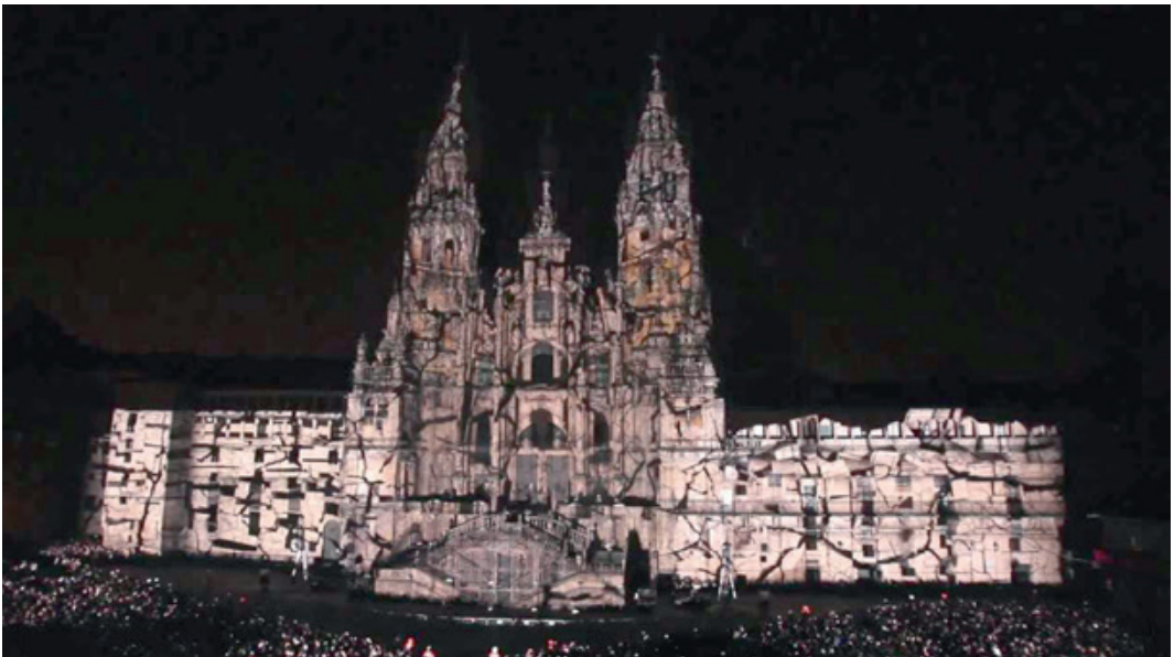
Ilustración 1: Espectáculo de Video Mapping en la Catedral de Santiago en el año 2012.