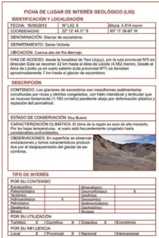
Figura 2: Ejemplo de ficha de un LIG (Modificado de Leynaud 2002)

Durante la etapa de campo se relevaron varios sectores de la sierra de Santa Victoria y se realizó el inventario de 50 geositios. Se generó una ficha con información de base para cada lugar de interés (Figura 2), que se empleó para la posterior evaluación cuantitativa de los geositios en la etapa de gabinete.