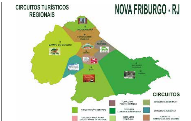
Imagem 2: Reprodução gráfica dos distritos turísticos de Nova Friburgo, 2009.