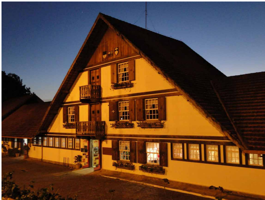
Imagem 5: Casa Suíça, distrito do Campo do Coelho, Nova Friburgo [RJ], 17 jun. 2012 [doc. Fot.]