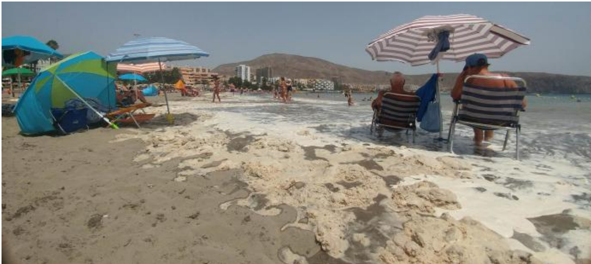
Imagen 2: Playa de Las Vistas (Arona) afectada por las microalgas durante el verano de 2017.

Hay que destacar que la proliferación de cianobacterias en las costas del Sur de Tenerife se atribuye a la cianobacteria marina Trichodesmium erythraeum . Este tipo de cianobacteria, es una de las principales encargadas de fijar/aproximar el nitrógeno en el mar, pues tiene un papel importante en los ciclos biogeoquímicos de los océanos, debido a los nutrientes que libera durante y al final de sus proliferaciones. Esta bacteria es ya conocida en las Islas Canarias, donde no se vincula con vertidos de aguas fecales, sino con ambientes sin nitratos. Así mismo, vive de manera natural en todos los océanos del mundo. Se trata de una especie visible a simple vista.