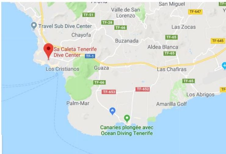
CENTRO DE BUCEO - SACALETA EN LOS CRISTIANOS

Los centros de buceo entrevistados fueron de dos zonas diferentes: 'Buceo Tenerife' en Las Galletas y 'SaCaleta' en Los Cristianos, ambos en el término municipal de Arona. Las zonas son próximas, pero la proliferación de cianobacterias no era la misma, pues en la zona de Las Galletas tuvo menor incidencia, debido a las corrientes y la ubicación de los centros. Cabe destacar, que los centros participaron en la investigación con extracción de muestras.