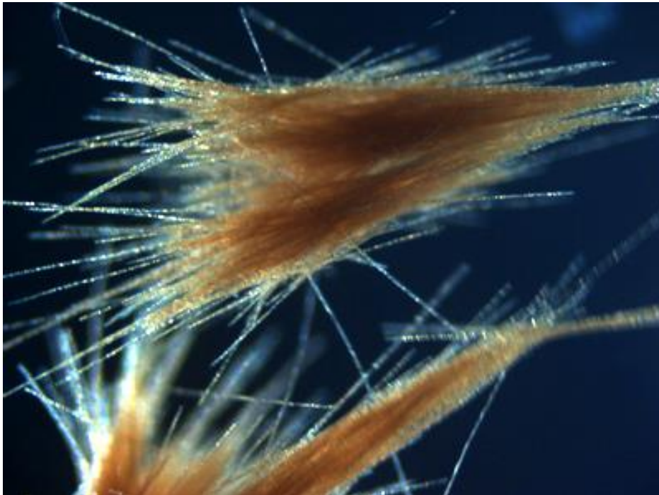
Imagen 1: Imagen de microscopio de Trichodesmium erythraeum .

Se definen a las microalgas como microorganismos unicelulares fotosintéticos que forman parte del fitoplancton marino. Es decir, corresponden a una serie de bacterias marinas que hacen la fotosíntesis como si fueran vegetales. Además, tienen una capacidad de crecimiento y de generación de biomasa mucho mayor que las plantas superiores, ya que no necesitan generar estructuras reproductoras, lo que les permite multiplicarse en cuestión de horas, llegando a alcanzar cientos de metros de estructura en la superficie marina. Cabe destacar que son necesarias para el mantenimiento de la vida de la Tierra, pues a través de la fotosíntesis son capaces de suministrar gran parte del oxígeno que necesitamos para respirar los demás seres vivos.