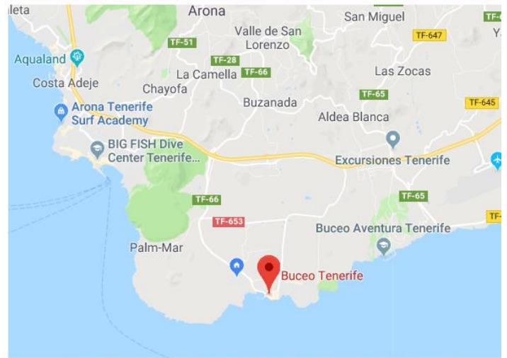
CENTRO DE BUCEO - BUCEO TENERIFE EN LAS GALLETAS

Imagen 5: Mapa de Google Maps con la ubicación de los centros de buceo 'SaCaleta' en Los Cristianos y 'Buceo Tenerife' en Las Galletas.