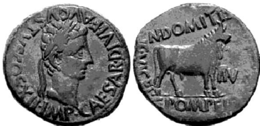
As de época de Augusto de la ceca de Celsa (RPC 278)

tas partes de los decuriones ni antes de encontrarse el interesado en Italia como simple particular; en caso contrario, se impondrá al contraventor una multa de 100.000 sesteracios.