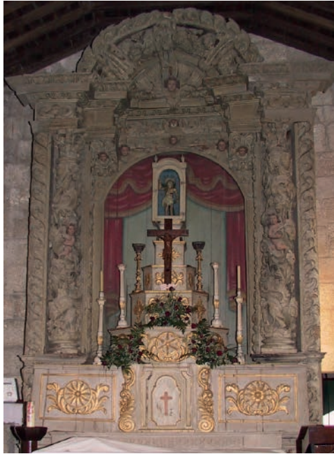
Fig. 3: Amarante. Igreja do Mosteiro de Freixo de Baixo