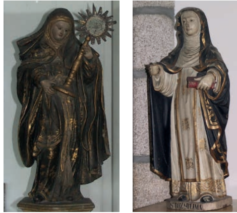
Figs. 6 e 7: Santa Clara e Santa Rosa Lima