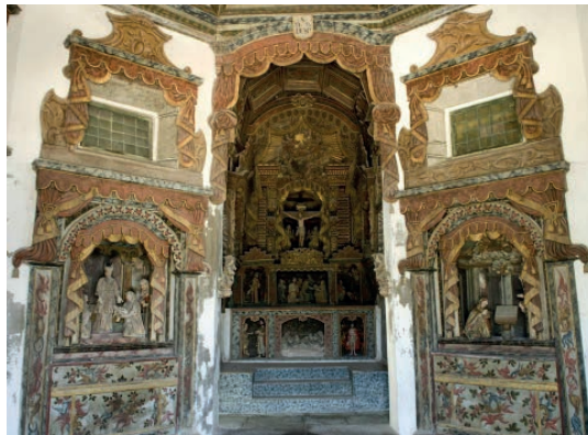
Fig. 10: Capela do Senhor do Bom Despacho

A capela do Senhor do Bom Despacho (Lagoa & Dias, 1991: 467-480), erguida em 1735 - considerada a justaposição da data -, no adro do mosteiro, conserva o retábulo-mor joanino (com acrescentos maneiristas que flanqueiam as pilastras). Programa iconográfico: os mistérios dolorosos e gloriosos da Vida de Cristo; no lado do Evangelho, a Ressurreição, com a legenda: Petit et accipietis