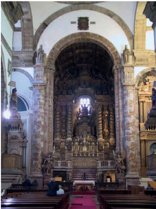
Figs. 4 e 5. Amarante. Retábulo-mor da igreja do convento de S. Gonçalo. Ilhargas da capela-mor da igreja de S. Domingos