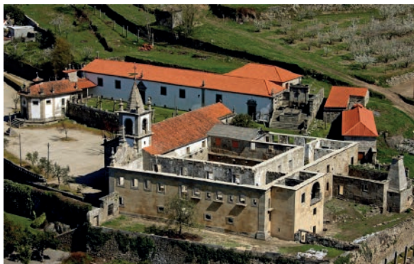
Fig. 8: Capela do Senhor do Bom Despacho, igreja e convento de S.to André de Ancede

A arquitetura da igreja passou por vicissitudes que não estão completamente esclarecidas; a cabeceira é de escala ampla – adequada para ter acolhido um retábulo maneirista – como predizem os caixotões da capela-mor e as naves. A rosácea é o elemento românico remanescente mais significativo, que se difunde, profusamente, no gótico.