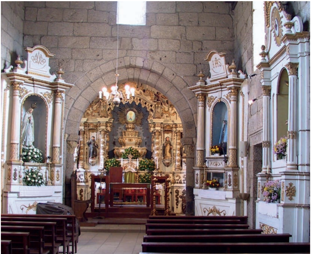
Fig. 2: Amarante. Igreja do mosteiro de Mancelos

Sintetizando: com a integração na RR, apresenta um portal românico (arquivoltas de transição para o gótico) arco cruzeiro igualmente de transição; na talha: i) retábulo-mor “ao estilo” barroco-rococó”; ii) retábulos colaterais e lateral da Epístola: neoclássico residual.