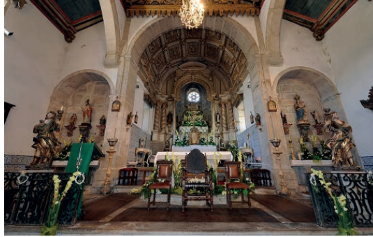
Fig. 9: Capelas mor e laterais da igreja do convento