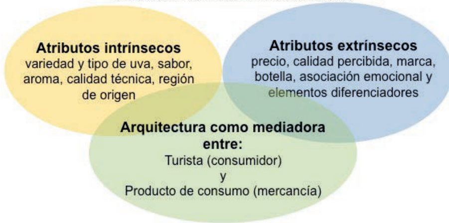
Figura 1: Turismo y Arquitectura Rutas Temáticas Itinerarios turísticos en torno a una bebida