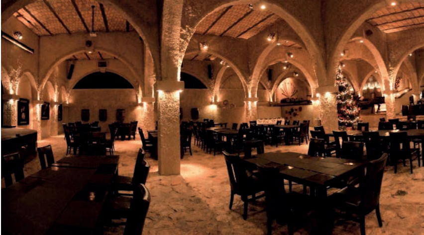
Imagen 4: Ruinas de la antigua Hacienda La Cofradía en Amatitán, Jalisco.