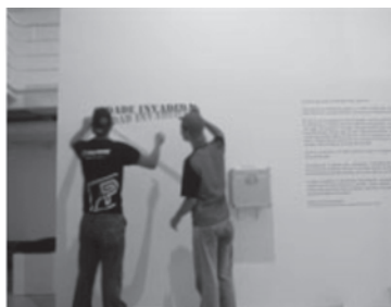
Ciudad invadida/Cidade invadida, un proyecto itinerante en la Universidad Federal de Minas Gerais.