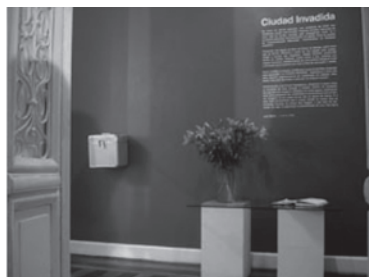
Ciudad invadida / Cidade invadida, un proyecto itinerante en la Universidad Federal de Sergipe, y en la Universidad Federal de Bahía.

rales y desde una perspectiva internacional. A finales de 2006, el CIAE, partiendo del apoyo otorgado por varias universidades brasileñas y por el Vicerrectorado de Cultura de la Universidad Politécnica de Valencia, emprendió una experiencia de contenido visual y teórico en el que las aportaciones efectuadas dieron pie al proyecto expositivo que nos ocupa. Dichas aportaciones quedaron recogidas en la publicación Ciudad invadida/Cidade invadida .