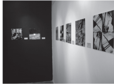
Ciudad invadida/Cidade invadida, un proyecto itinerante en la Universidad Federal de Brasilia.

resultados visuales obtenidos han sido publicados en los siguientes volúmenes de la Editorial Contrastes de Valencia durante el año 2007: