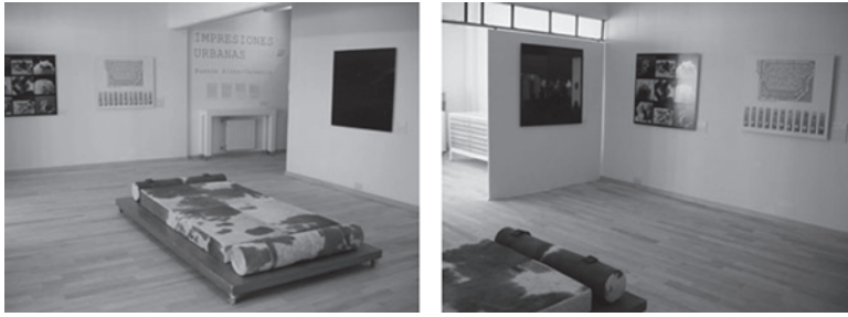
Impresiones urbanas 06 en la VVV Gallery de Buenos Aires.