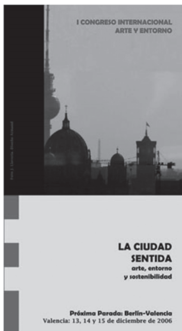
Imágenes de las mesas redondas y ponencias. Portada del tríptico anunciador del Congreso.

taron con la participación de entidades como Renfe, Telefónica y los Ayuntamientos de diversas poblaciones.