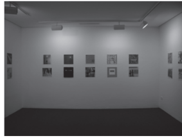
Ciudad invadida/Cidade invadida, un proyecto itinerante en la Sala Josep Renau de la Facultad de BBAA, UPV.