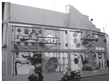
Fase de elaboración de la pintura mural en Alginet, Valencia, 2005.