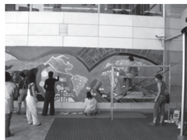
Desarrollo de la pintura mural para el Palacio de Congresos WACAP, 2006.