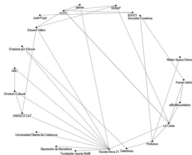
(Imagen 4. Red política filantrópica experimental).

Mediante una alianza filantrópica emergente entre fundaciones de empresas del IBEX 35 (Telefónica y CaixaBank), actores simbólicos, fundaciones y gobiernos se constituye la red política filantrópica experimental (ver imagen 4) que tiene como meta paliar las problemáticas del sistema educativo creando políticas experimentales basadas en la innovación en las aulas. En Cataluña, a través de «Escola Nova21», una hibridación público-privada (Fundación Jaume Bofill, Centro UNESCO de Cataluña, Diputación de Barcelona, Universitat Oberta de Catalunya y Fundación EduCaixa) lideran la agenda política para la transformación del sistema educativo mediante la innovación educativa. Etiquetan colegios innovadores y no innovadores que consecuentemente comienzan a producir nuevas lógicas de mercado escolar. Fundamentan su formación en lógicas discursivas de políticas educativas experimentales junto a decisiones programáticas basadas en los estudios de las corrientes «qué funciona» (what works) y «políticas basadas en la evidencia» (evidence-based policy making). Estas lógicas discursivas son propias del nuevo régimen de políticas rápidas (Jessop, 2014; Peck & Theodore, 2015).