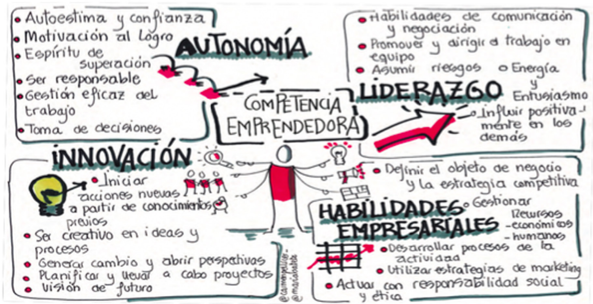
(Imagen 2.).