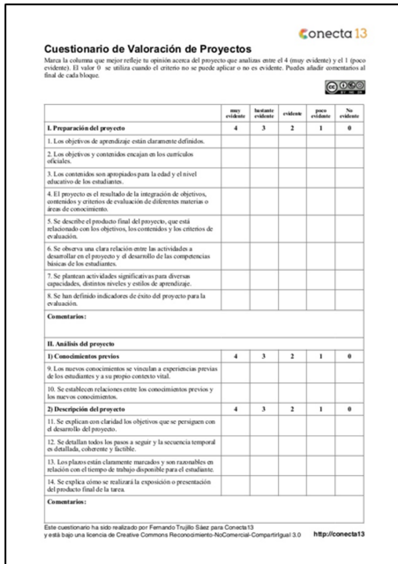
Figura 9. Cuestionario de evaluación.