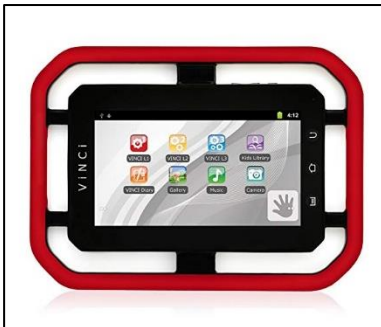
Figura 4. Vinci tabs.