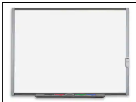
Figura 5. PDI.