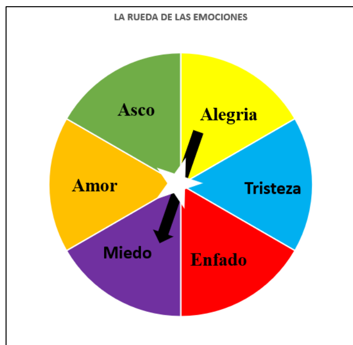
Figura 2. La rueda de las emociones.