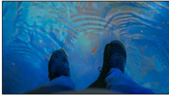
Figura 6. Alfombra interactiva.