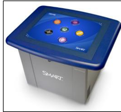
Figura 3. Smart-table.