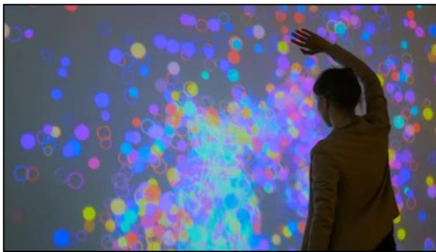
Figura 7. Pared interactiva.