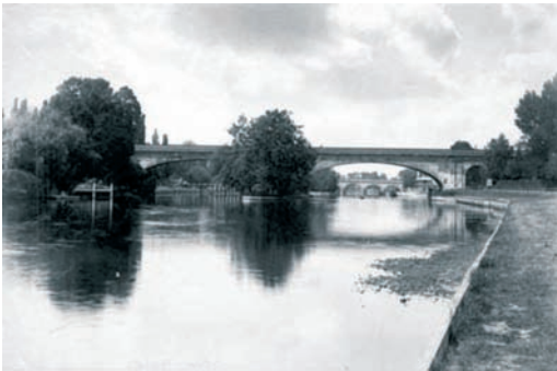
Figura 4: Taunt. Maidenhead Railway Bridge .1883.

Será esse olhar romântico, associado ao pitoresco e não ao sublime, que irá embalar este outro fenômeno social que começa a se manifestar neste mesmo século: o Turismo. Antes de aprofundar esta outra aproximação, se faz necessário resgatar também o percurso da paisagem, para então aproximá-la, como imagem privilegiada, ao turismo.