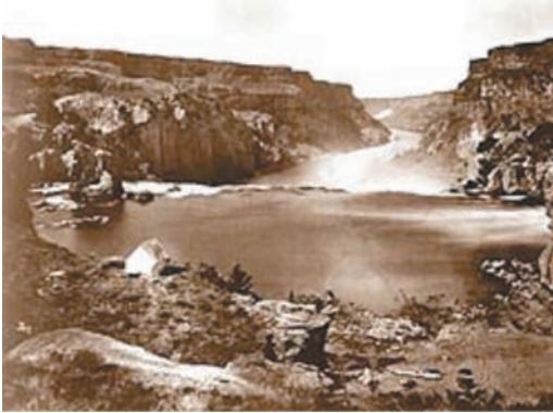
Figura 3: O’Sullivan. Shoshone Falls, Idaho . 1868

Em termos de construção visual, outra foto, esta de Henry Taunt, aproxima ainda mais a estética do pitoresco, na sua reprodução de uma cena de tranquilidade: