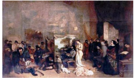
Figura 6: Courbet, G. Estúdio do Pintor . 1855. Acervo Museu D’Orsay, Paris.

A ordenação visual iluminista, associada à perspectiva, será desafiada pela tecnologia do século XIX, a partir do momento em que a imagem é desconstruída na paisagem vista pela janela do trem ou registrada pela máquina fotográfica. Muda o olhar, menos orientado pela racionalização implícita na perspectiva: a paisagem que passa célere pela janela, fala antes ao sensorial do que ao intelectual do observador. De certa forma, nesse momento se inicia o processo de desmaterialização da imagem-paisagem. Os impressionistas registraram essa mudança em suas telas, com suas pinceladas fluídas, a figura liberando-se da prisão da linha. A pesquisa modernista posterior manterá vertentes de construção visual atreladas à experiência sensorial, em especial em termos de cor – como no impressionismo e noutros abstracionismos – e outras vertentes racionalistas, como o cubismo e o concretismo, trabalhando em especial a partir da linha.