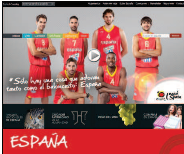
Fig.2 Cabecera de la página inicial

fondo negro, encontramos desglosada la que será, grosso modo , la estructura de las sucesivas páginas del portal: cabecera, cuerpo y pie de página.