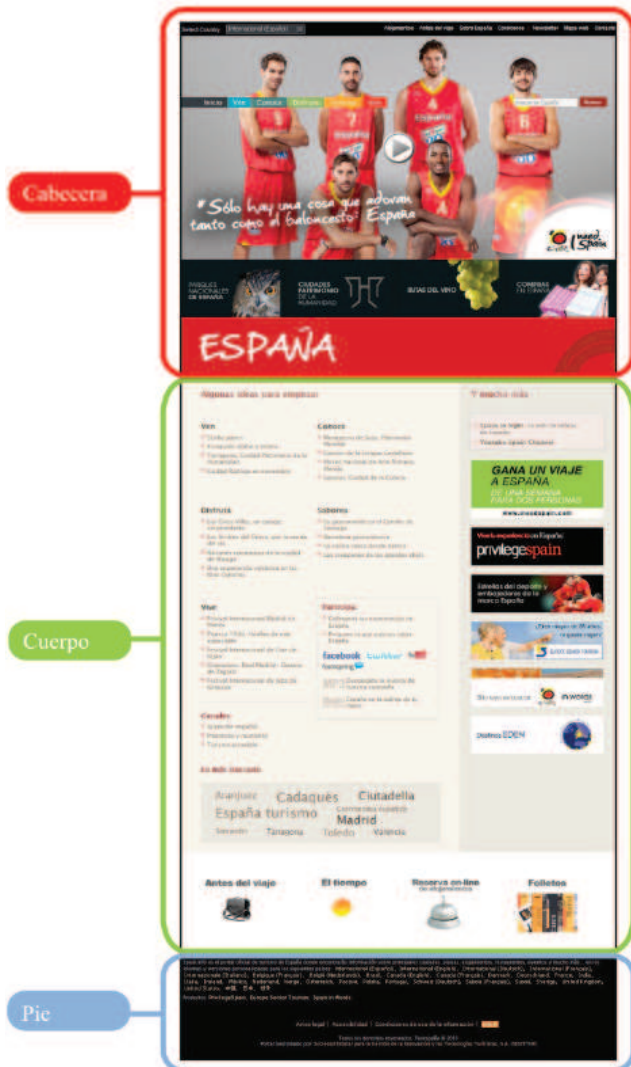
Fig.1 Macroestructura de la página inicial

con la que se pretende dar apoyo a la campaña promocional 'I need Spain'. Entre otras cosas, se subraya, por ejemplo, que esta estrategia genera "menos coste que la promoción en medios convencionales y es más efectiva" 20 .