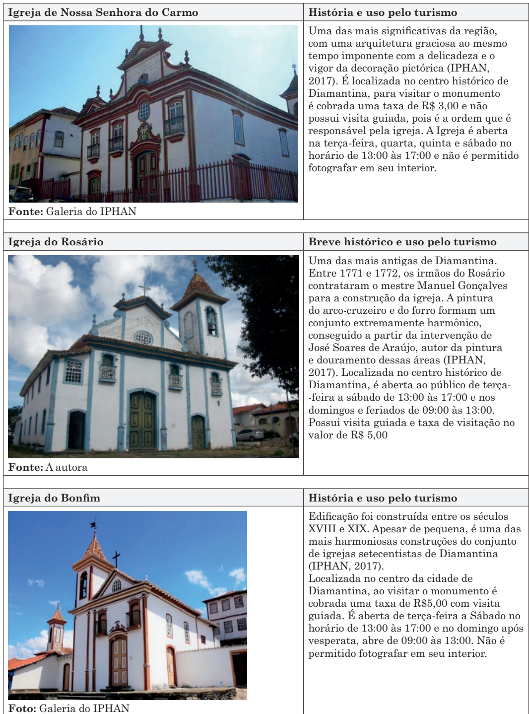
Tabela 9: Possibilidades interpretação patrimonial nos monumentos religiosos