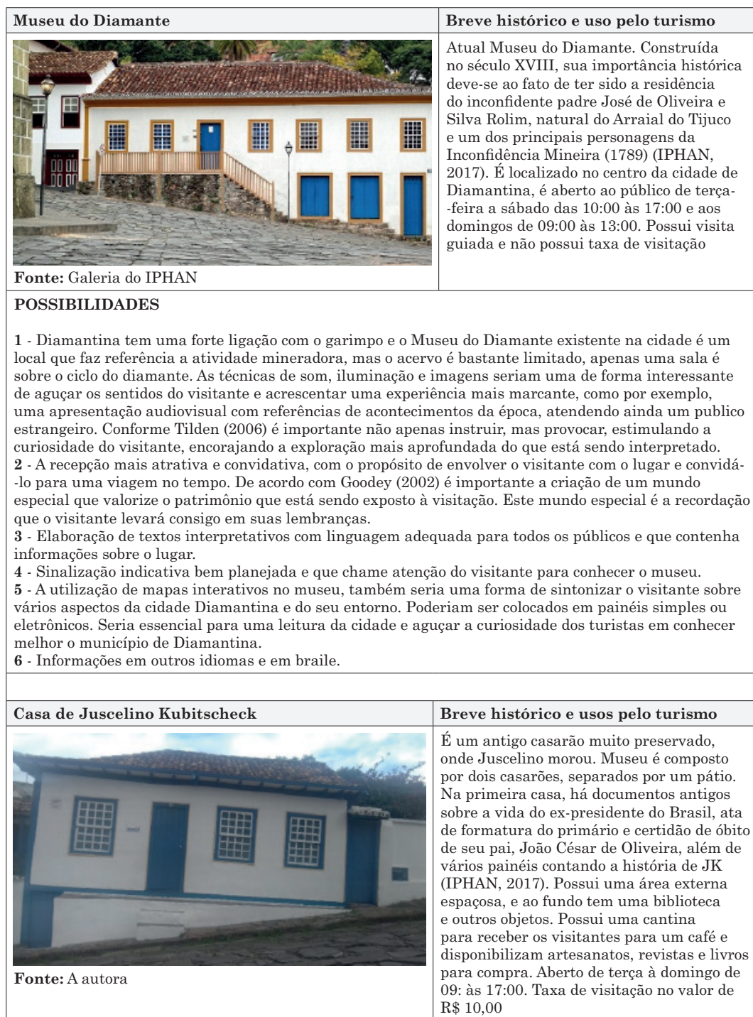
Tabela 8: Possibilidades interpretação patrimonial