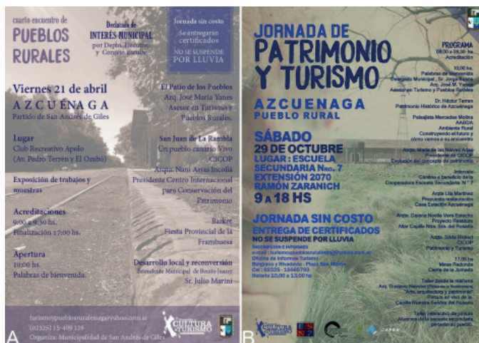
Figura 4: A. Banner del Cuarto Encuentro del Patio de los Pueblos -Pueblos Rurales- (2009). B. Banner de las primeras jornadas de patrimonio y turismo (2016) en Azcuénaga, San Andrés de Giles

Asimismo, la Asociación -con apoyo del municipio- también promovió eventos, no solo turísticos, sino de discusión con pobladores de otros municipios y profesionales vinculados al patrimonio de relevancia nacional, como el “Primer encuentro regional El Patio Pueblos”, declarado de “Interés Municipal” (Ordenanza 1403/2009). En el año 2016 se organizó la Primera Jornada de Patrimonio y Turismo (Figura 4), la cual tuvo su continuidad en el año 2017.