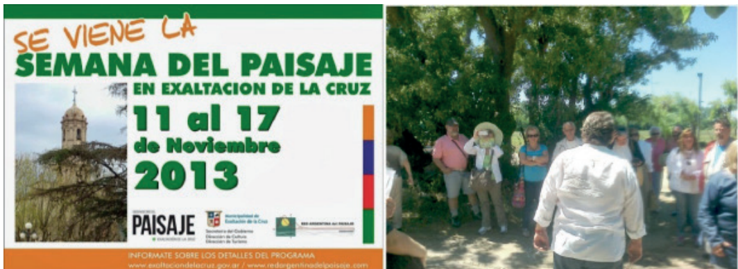
Figura 3: Banner de la inauguración del Observatorio del Paisaje, fuente: Dirección de Turismo; fotografía sobre la realización de uno de los talleres en las afueras de Capilla del Señor.