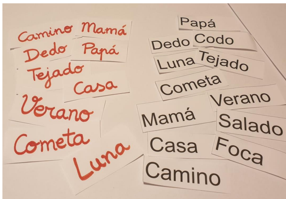
(Ejemplos de palabras con ambos tipos de letras)