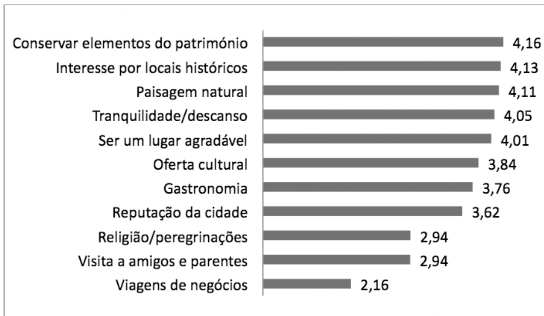
Figura 1: Fatores na escolha da visita a esta cidade

Grau de importância (1- Nada importante; 5 - Extremamente importante) - Médias