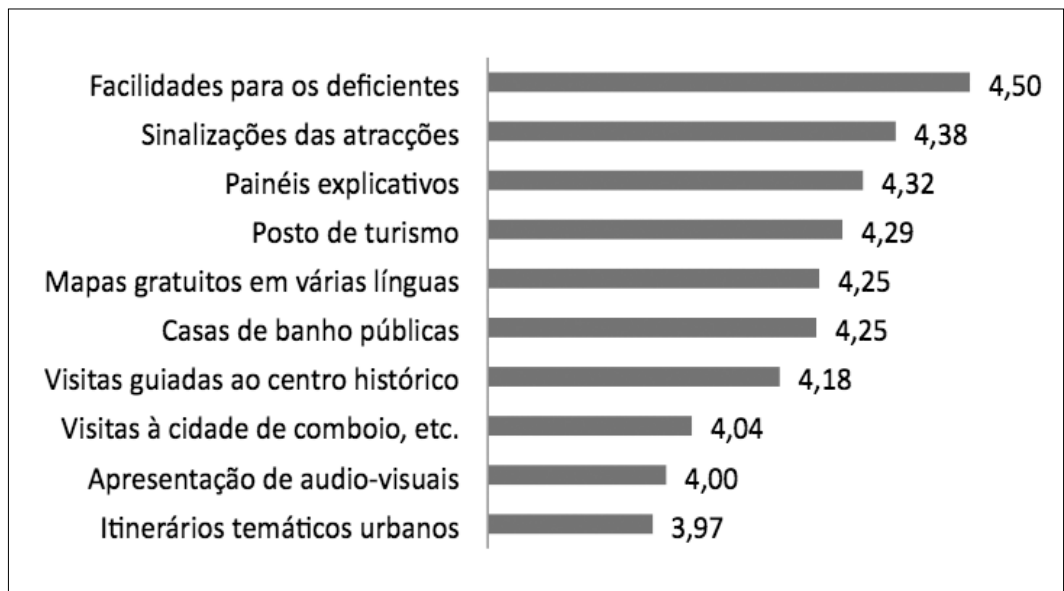
Figura 3: Acolhimento e informação da cidade

Grau de concordância (1- Discordo totalmente; a 5 - Concordo totalmente) - Médias