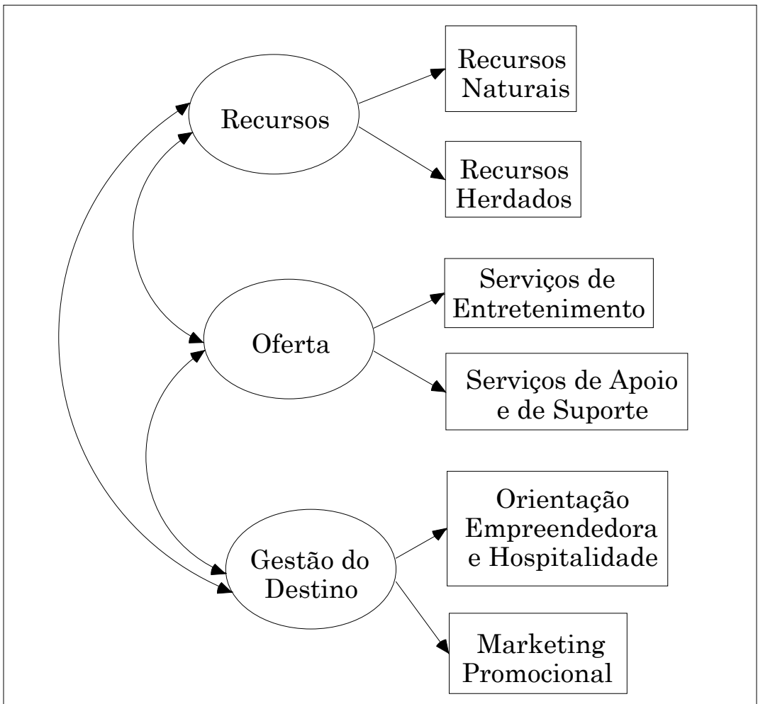
Figura 1: Modelo Explicativo da Competitividade Turística

Os critérios utilizados na construção do modelo final aqui apresentado basearam-se no estabelecimento e eliminação de relações entre variáveis que conduzissem a uma melhor qualidade do ajustamento, desde que de acordo com os fundamentos teóricos estudados, tendo a análise das medidas de bondade do ajustamento e dos índices de modificação assumido um papel importante nesta análise.