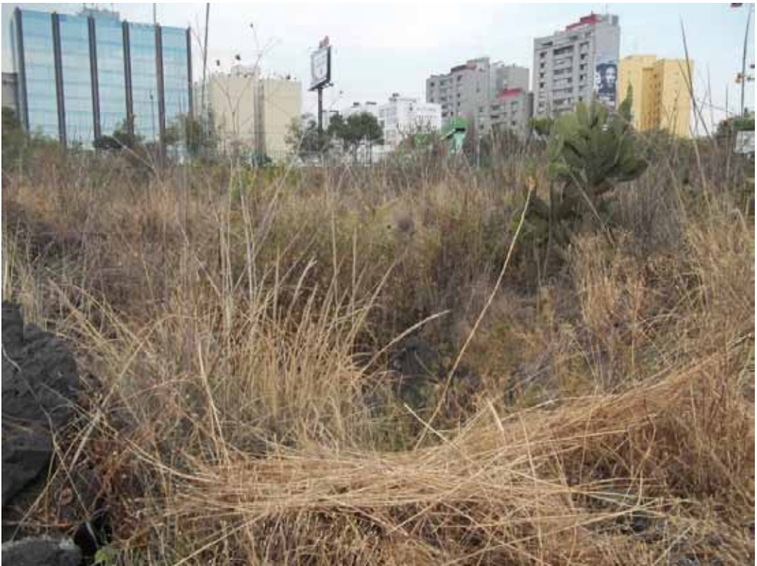
Foto 1. Matorrales secos en Cuiculco

que pueden generar incendios. De acuerdo con el INAH, se registraron de uno a tres incendios por temporada en el periodo 2004-2009. Ninguno de ellos alcanzó la zona de monumentos, fueron desde pequeñas llamas hasta incendios con varios metros de extensión. En PET se destinaron más de 235 mil pesos para generar 25 empleos de abril a junio. Las tareas a realizar fueron el desyerbe, poda, mantenimiento de los andadores y limpieza general. De acuerdo al INAH, este programa de atención contra incendios forestales aplica desde ese año en la zona arqueológica, hecho contrastante con la realidad. Actualmente, la flora del sitio crece sin control ni cuidado alguno, se pueden encontrar algunos matorrales completamente secos impidiendo el crecimiento de los nuevos y con riesgo de encenderse (Foto 1). Por otra parte, en ese mismo año el Museo de Medicina Tradicional y Herbolaria, de Morelos, realizó un inventario florístico de la zona arqueológica. Se identificaron 64 tipos de plantas, de los cuales sobresalen estafiate, mastuerzo, oreja de burro y uña de gato (INAH, 2010).