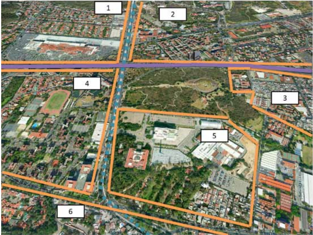
Figura 2. Entorno de Cuicuilco en el Siglo XXI