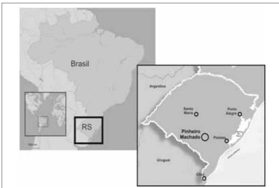
Figura 1. Mapa de localização da cidade de Pinheiro Machado/RS.

O município de Pinheiro Machado está localizado na zona sul do estado do Rio Grande do Sul, no Brasil (Figura 1). Desmembrou-se do município de Piratini e iniciou o povoamento de sua sede em 1830, a qual foi elevada à categoria de freguesia em 1857, inicialmente, com o nome de Nossa Senhora da Luz das Cacimbinhas. Foi elevada a vila em 1878 e cidade em 1938. Em 1915 adotou o nome de Pinheiro Machado através de ato municipal (Fortes; Wagner, 1963, p.121).