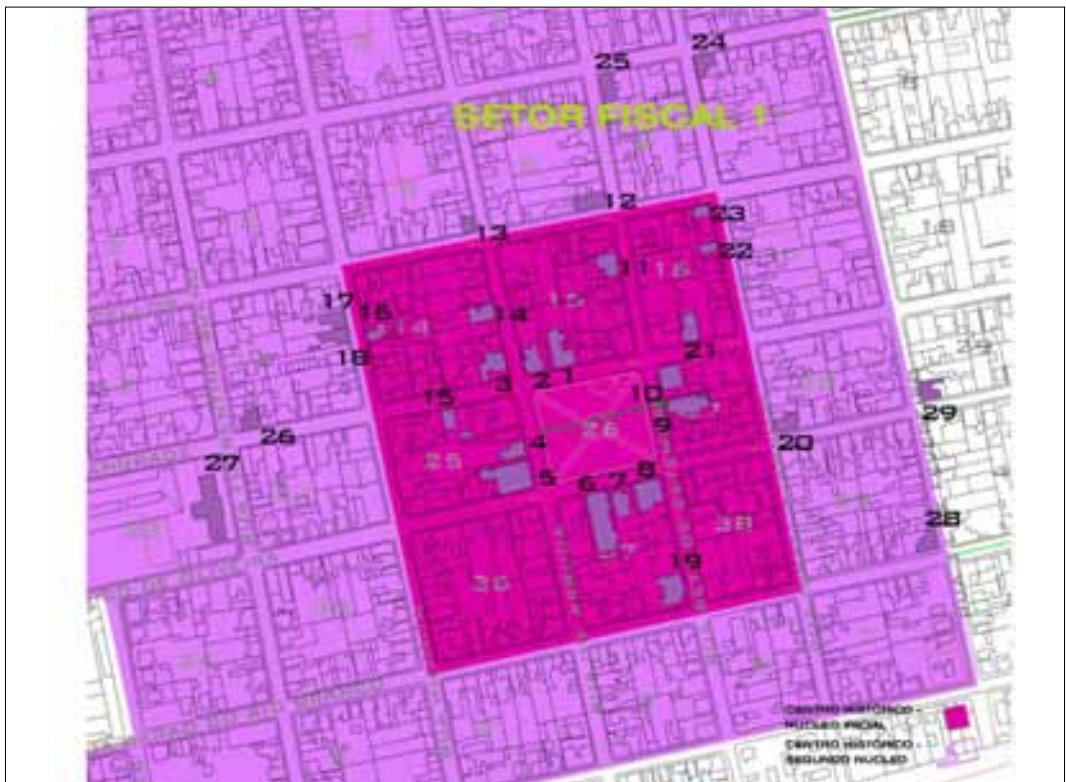
Figura 3. Mapa da zona central de Pinheiro Machado/RS com a localização das edificações elencadas como patrimônio arquitetônico cultural, com legenda.

Dessa forma, o mapa do centro de Pinheiro Machado (Figura 2) mostra a concentração das construções no centro da cidade, em seu primeiro núcleo (em rosa) e dentro dos limites do perímetro referente ao Projeto da Diretoria de Saneamento e Urbanismo de 11/02/1947 (em lilás).