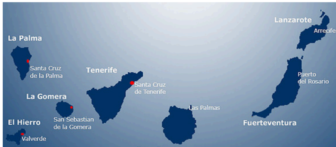
Gráfico 1: Mapa de las islas Canarias