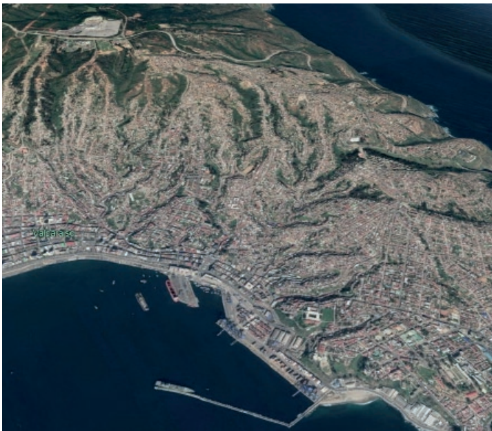
Imagen 1: Valparaíso y su entorno

La ciudad está emplazada sobre una antigua playa de arena, y sobre un terreno que se le ha ido ganando al mar. Se trata de una bahía rodeada de una cadena montañosa, formando un anfiteatro hacia el Pacífico. Siendo sus componentes principales: 1- La bahía, como límite natural del desarrollo urbano de la ciudad, el cual se mantuvo en su forma original hasta el comienzo de la privatización del puerto. 2- El plan, una planicie entre los cerros y la bahía, formada también por el material proveniente del relleno de los espacios ganados al mar y de los escombros provenientes de sismos. 3- Y los cerros que configuran junto a los grandes valles y terrazas uno de los principales atractivos de la ciudad. Cabe destacar por otra parte, que los habitantes de los cerros acumulan casi al 90% de la población de la ciudad (imagen 1).