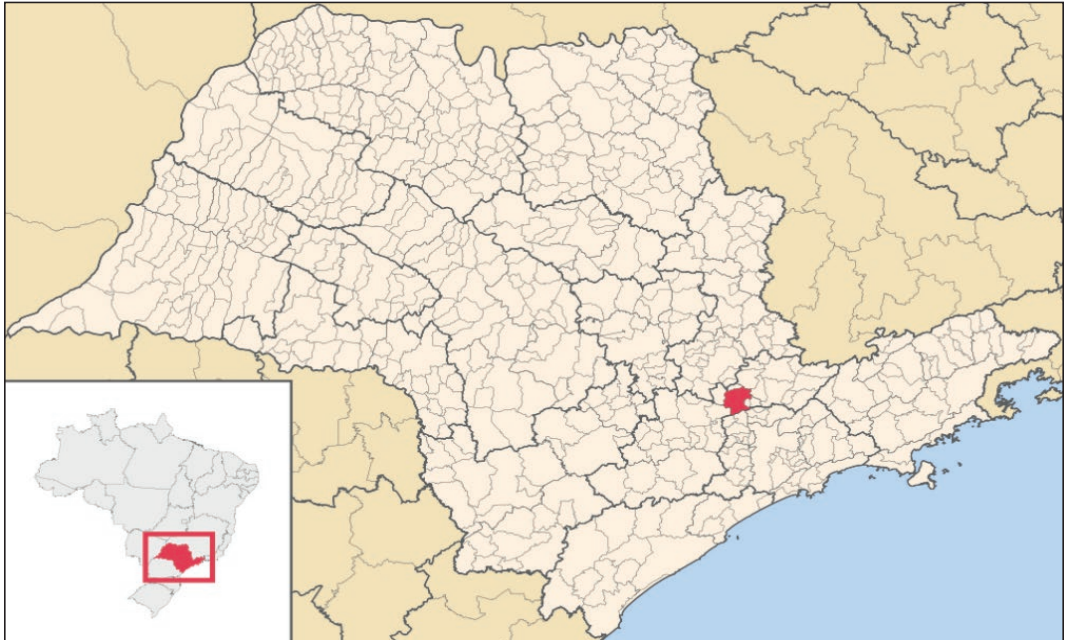
Figura 1: Mapa de localização município de Jundiaí-SP (Brasil)