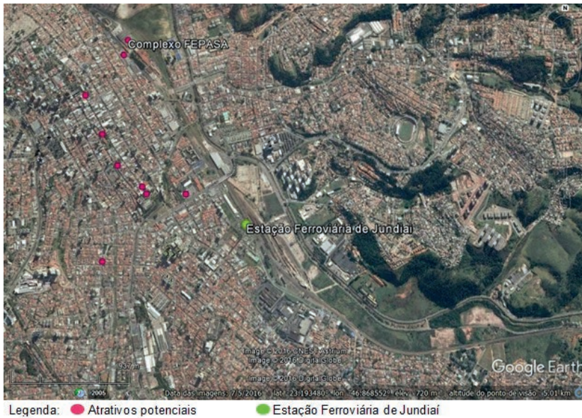
Figura 10: Mapa atrativos histórico-culturais no entorno da Estação Ferroviária de Jundiá e Complexo FEPASA.