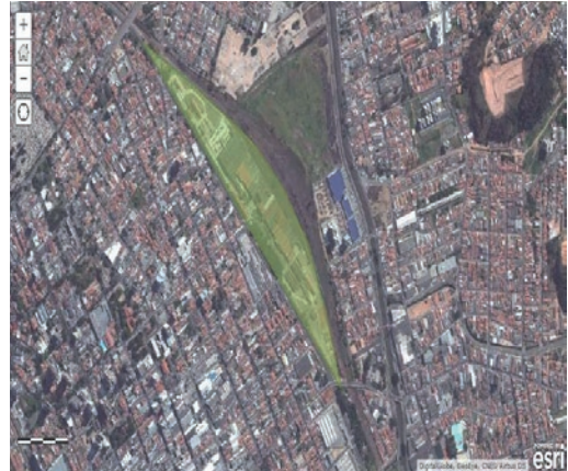
Figura 3: Conjunto de Edificações e Bens Móveis da Companhia Paulista de Estradas de Ferro.