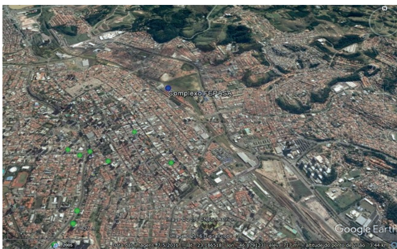
Figura 9: Mapa dos Meios de Hospedagem no entorno do Complexo FEPASA.

Legenda: ● Meios de Hospedagem ● Complexo FEPASA