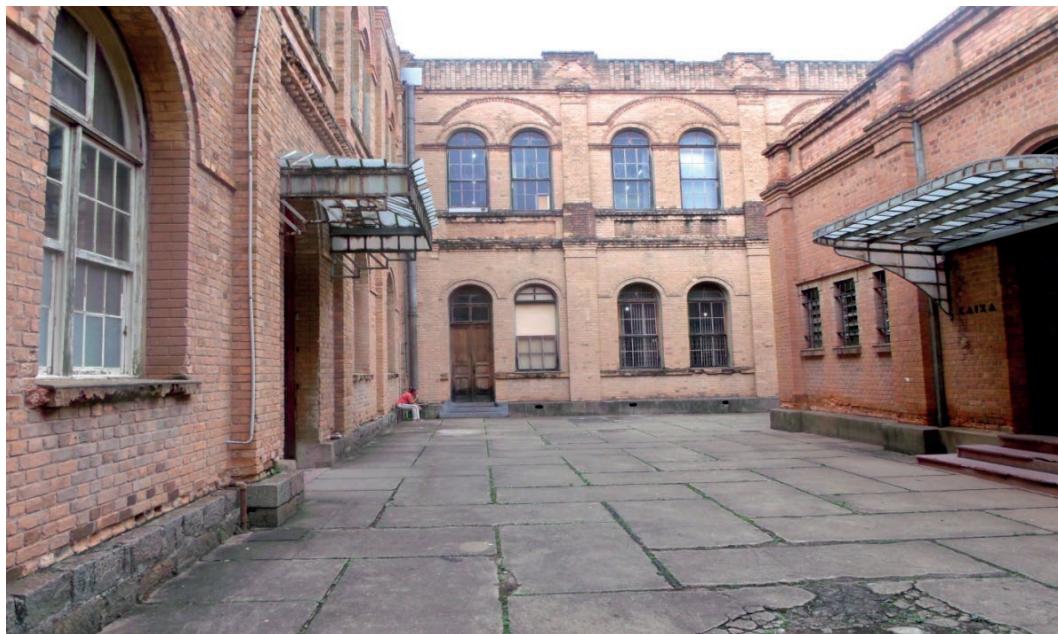
Figura 5: Oficinas Complexo FEPASA.