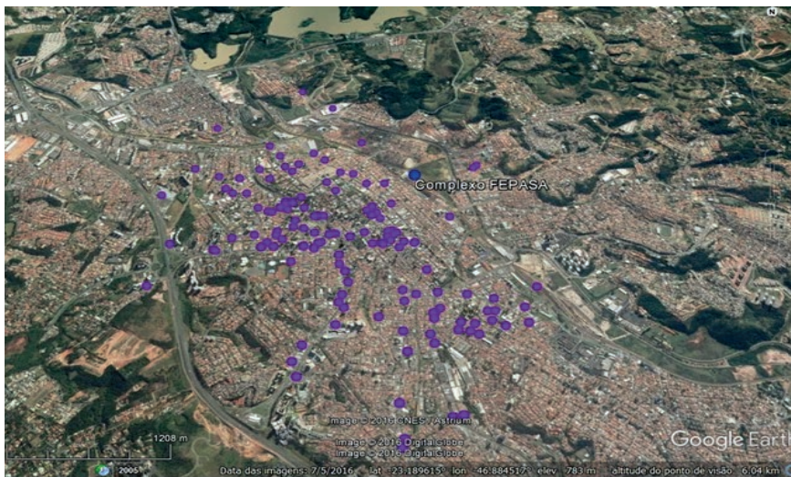
Figura 7: Mapa dos serviços de alimentação no entorno do Complexo FEPASA.

Legenda: ● Alimentação ● Complexo FEPASA