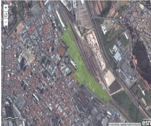
Figura 2: Complexo da Estação Ferroviária de Jundiaí.