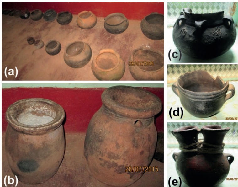
Figura 1: Objetos tradicionales en cerámica del poblador huamburquino, una comunidad rural del departamento de Apurímac – Perú.

Fonte: (a) Allpa manka (ollas de barro), de diferentes tamaños y ornamentas, presenta dos o eventualmente cuatro asas en la parte superior para facilitar el retiro de la fogata. (b) Burun, hecho de arcilla especialmente para el depósito de manteca (grasa de cerdo), a diferencia de allpa manka y tinaqa presenta un espesor mayor y en el cuello tiene un orificio que sirve para oxigenación, permitiendo así mantener la manteca en óptimas condiciones un tiempo mayor. (c, d, e) Tinaqas, hecho especialmente para servir chicha o aguardiente, utilizada principalmente en fechas festivas o reuniones importantes, muy ornamentadas y algunas veces con formas de animales del lugar. Fotografías sin escala, véase el texto para tener referencia del tamaño.