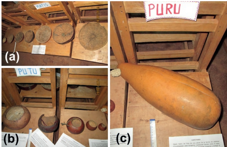
Figura 3: Material tradicional del poblador huamburquino, una comunidad rural del departamento de Apurímac – Perú, confeccionada a partir del fruto de plantas de la familia Cucurbitaceae.

Fonte: (a) Mati (platos), dependiendo el tamaño y espesor se usa para diferentes objetivos, por ejemplo, para mote (mote mati o anqara), sopa (lawa mati), ají (uchu mati), moldear queso (buyllu mati) o para el cernido del caldo hirviente de jora en el preparado de chicha (upi mati). (b) Putu, usado para depósito de granos, cuajo o suero de vaca (llukllu putu) que se agrega a la sopa. (c) Puru, se usa para transportar sustancias líquidas como el agua, aguardiente (trago) o chicha. En la figura también se observa la improvisación en la exposición de estos objetos. Fotografías sin escala, véase el texto para tener referencia del tamaño.