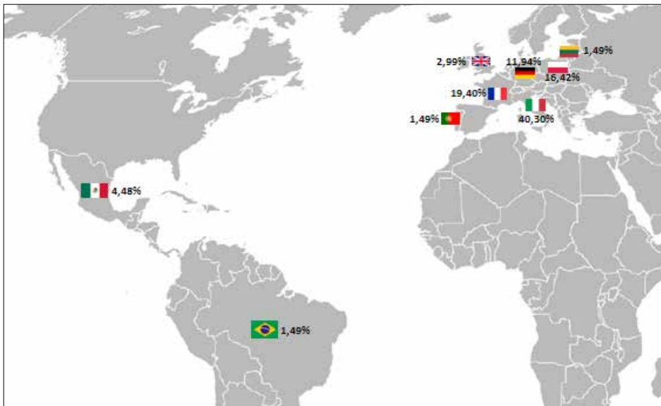
Figura 1: Lugares de procedencia del estudiante internacional de la universidad de Córdoba

De acuerdo con las encuestas realizadas, el perfil del estudiante internacional de la Universidad de Córdoba es mayoritariamente femenino (74,63%). La edad media se sitúa entre 21 y 22 años. Un 82% de los estudiantes internacionales que recibe la universidad de Córdoba visita esta ciudad por primera vez frente a un 18% que repite experiencia. De éstos últimos, cerca de la mitad (46.15%) han visitado la ciudad más de 3 veces. La duración media de la estancia es de 10 meses, lo que supone un curso académico en su totalidad. El lugar de procedencia del estudiante internacional registra un claro predominio europeo (94,03%) como consecuencia del desarrollo en el tiempo del programa ERASMUS. En la siguiente Figura 1 se puede observar con más nivel de detalle los orígenes del estudiante internacional.