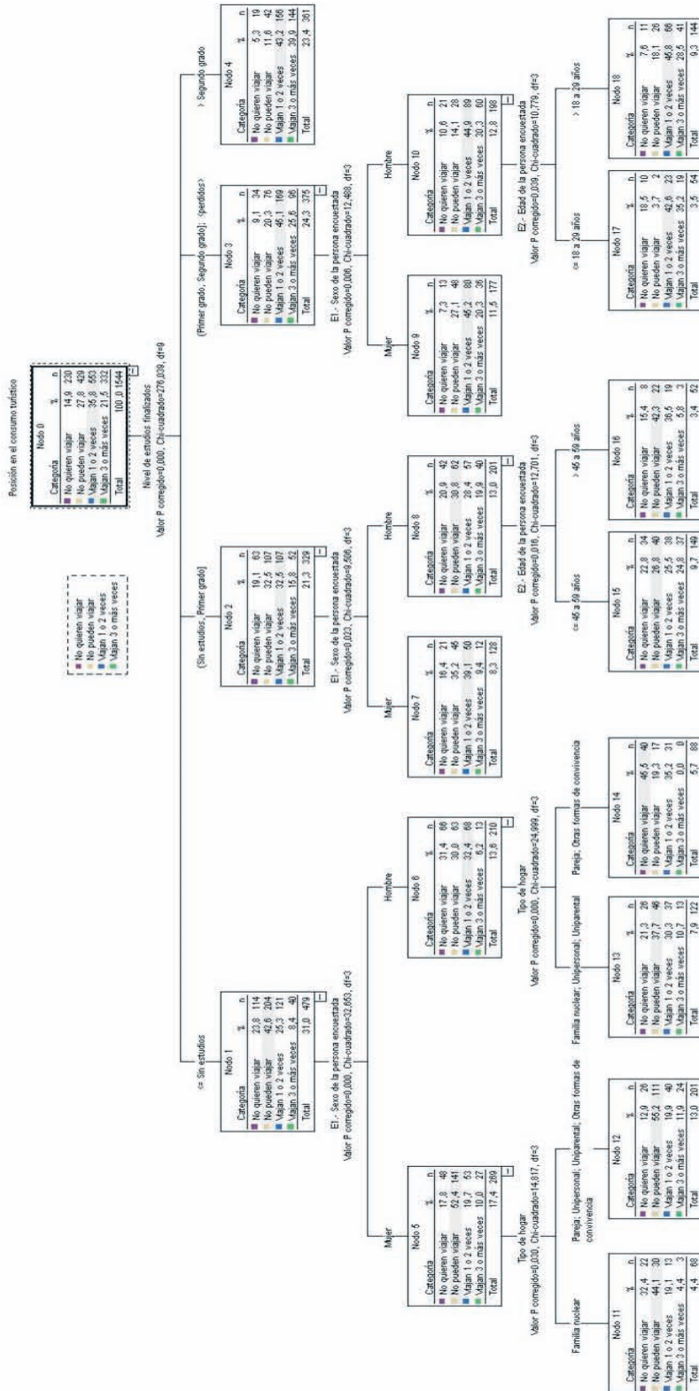
Gráfico 1. Árbol de segmentación. Todas las variables predictoras (A1)