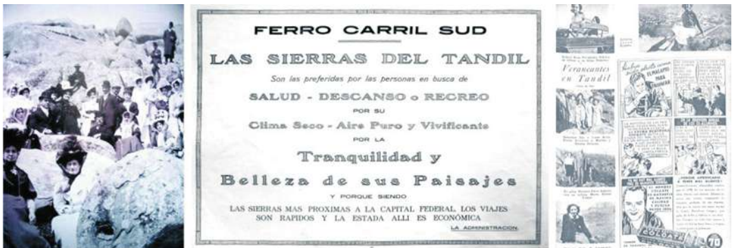
Imagen 5: Composición en la que se observan veraneantes tandilenses de principios del siglo XX (circa 1900), junto a la promoción del ferrocarril como medio destacado de acceso turístico (1923) y el renovado espectro social veraneante cerca de mediados del mismo siglo (1939).