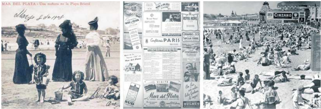
Imagen 3: Composición en la que se observan veraneantes marplatenses de principios del siglo XX (1908), junto a la amplia oferta asociada al turismo sobre mediados del mismo siglo (1938) y el cambio social acontecido (circa 1938-39, nótese la convivencia de la Rambla Bristol, a punto de desaparecer, con la edificación del Casino).

Fuentes: Postal social N° 5982 de "Fotos de Familia" del diario La Capital , disponible en: http://www.lacapitalmdp.com/contenidos/fotosfamilia/ ; aviso publicitario del diario La Nación , 10/12/1938, p. 7, de la Hemeroteca de la Universidad Nacional de La Plata y fotografía N° 5503 de "Fotos de Familia" del diario La Capital , disponible en la dirección citada.