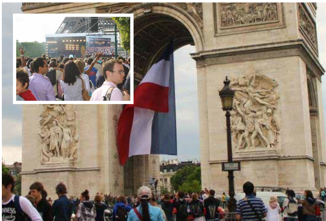
Mosaico 1: Festa Nacional da França. Em destaque os dois monumentos mais representativos.