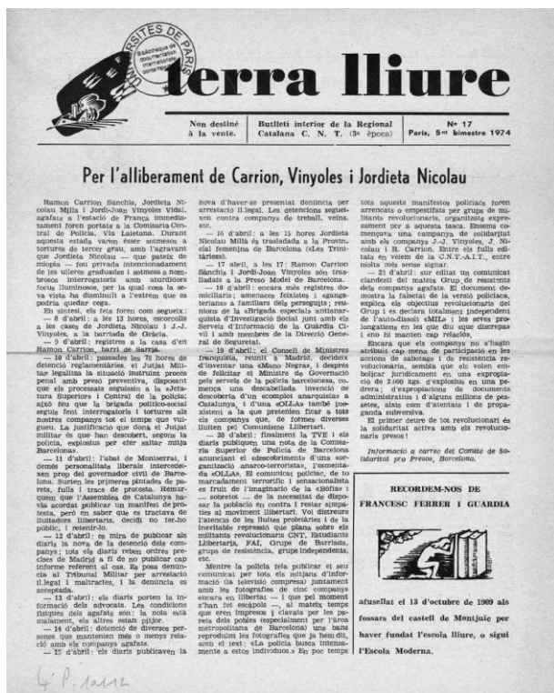
Image 2 : Terra lliure : Butlletí de la Regional Catalana C.N.T. , une du n° 17 (1974). Titre publié à Paris.

Aujourd'hui, La contemporaine offre quelques 130 000 documents numérisés consultables dans sa bibliothèque numérique sur le web, ou dans les locaux de