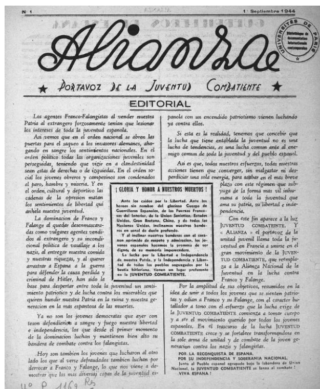
Image 1 : Alianza : Portavoz de la Juventud Combatiente, une du n° 1 (septembre 1944) [Lieu de publication inconnu]

diverse et à la durée de vie parfois éphémère. Entrées par achats ou dons, elles constituent des ensembles bien identifiés ou font partie de corpus plus larges, notamment dans le cas de fonds d'archives déposés auprès de La contemporaine. Au sein de ces fonds d'archives se côtoient tracts, brochures, bulletins, documents non publiés qui témoignent de l'action d'organisations, ou d'individus, engagés en particulier dans des mouvements de défense des droits de l'homme.