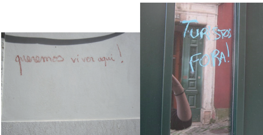
Figura 2 e 3: Informação registada em Alfama, Abril de 2017