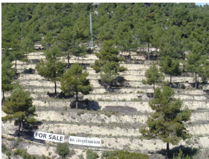
Foto 6. "For sale": la inmersión lingüística en los entornos turísticos.

Junto al mundo laboral y el recurso a los informes externos, otra de las dimensiones culturales que mejor informan de la presencia simbólica del turismo como una gramática que construye sentidos ordenando elementos conforme a nuevas reglas sintácticas y semánticas es la estética. El turismo en general, y el rural en particular, supone un goce para los sentidos y en la Bonaigua ese hedonismo radica, inicialmente, en el disfrute de la naturaleza, el silencio y la tranquilidad.