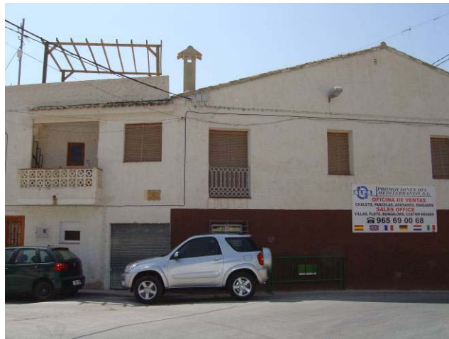
Foto 2. Neocolonización del espacio de calidad: 4 x 4 e inmobiliarias.

luta; por ello, aunque estratégicamente no abandonemos del todo el turismo como forma de desarrollo, la apuesta se encuentra en el sector industrial y en la construcción del nuevo polígono”. La construcción, formada por pequeñas empresas dedicadas a la albañilería de pequeña escala (reformas y rehabilitaciones), es una realidad que tiene su manifestación simbólica en la creciente presencia de nuevos usos urbanos, inmobiliarias y promociones de viviendas como se recoge en las siguientes ilustraciones.