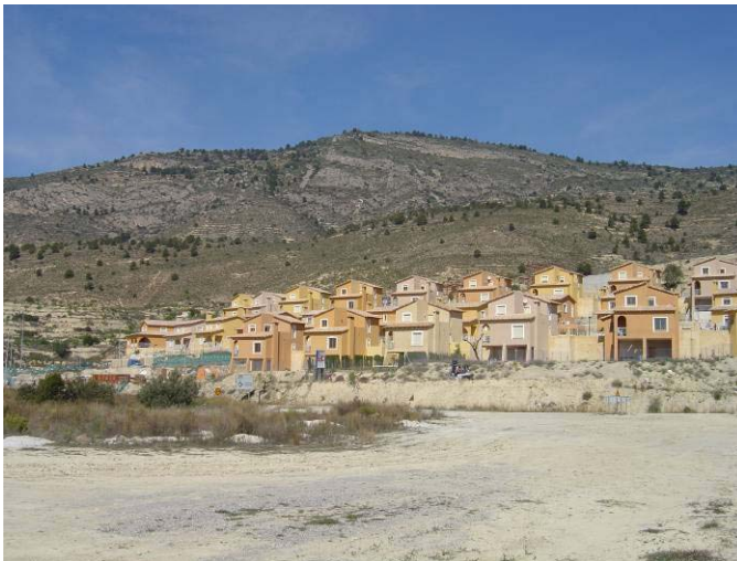
Foto 1. Ruptura del paisaje. Globalismo estético.